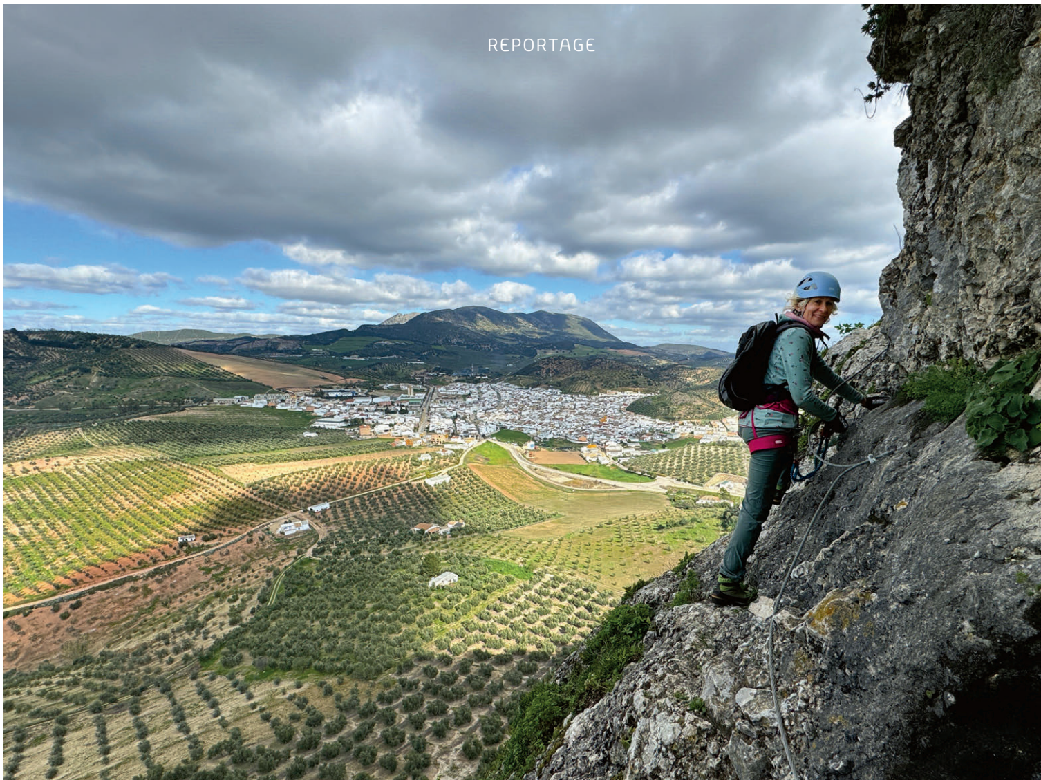
Der Klettersteig Via Ferrata Castillo del Hierro bei Pruna ermöglicht, eine beeindruckende Felswand zu erklimmen, die Ruinen des Castillo del Hierro zu erreichen und dabei einen spektakulären Panoramablick zu genießen.