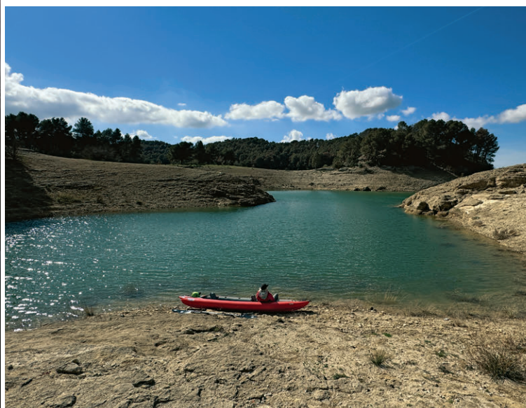
Kajaktour auf dem Embalse de Guadalhorce, um den auch eine schöne Wanderung (September bis Mai) führt.

in die Weiten des Weltalls zu blicken. Und wir nutzen den fotogenen Ort, um die Nacht zu verbringen und den atemberaubenden Sternenhimmel zu genießen. Unsere Bedenken, die Dieselheizung könnte in dieser Höhe versagen, erweisen sich als unbegründet. Diese knattert die ganze Nacht zuverlässig vor sich hin und lässt uns von frostigen Minustemperaturen im MUK nichts spüren. Nichtsdestotrotz fahren wir am nächsten Morgen zum Embalse de Negratin, um uns in den heißen Quellen von Zujar ein warmes Bad zu gönnen – eine warme Badewanne vor dem Wohnmobil sozusagen.