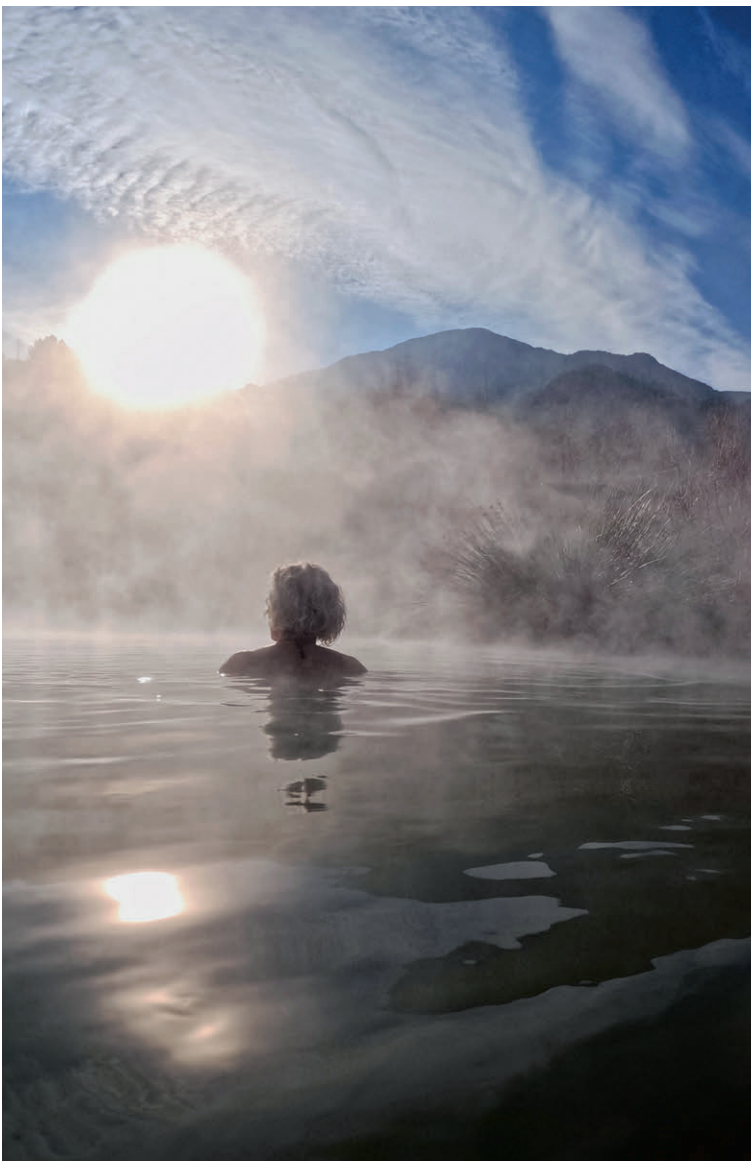
Warmes Freiluftbad in den Baños de Zujar, einer sehr schönen, natürlichen Thermalquelle bei einem Restaurant mit tollem Ausblick.