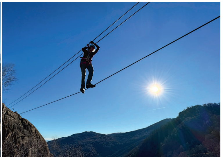
Die Via Ferrata Picasass ist ein Klettersteig, der kurz vor dem Gipfelkreuz eine 30-Meter-Seilbrücke aufweist, die man aber auch umgehen kann.