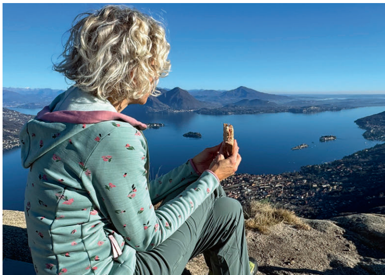
Die Via Ferrata Picasass bei Baveno bietet famose Ausblicke über den Lago Maggiore, wie hier auf die Bucht von Verbania.