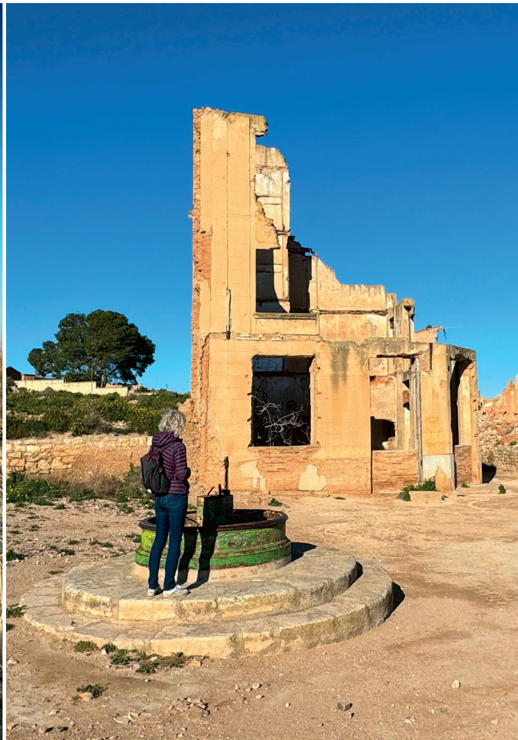
Die Geisterstadt Belchite hat eine düstere Vergangenheit.