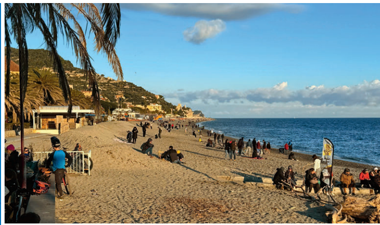
In Finale Ligure an der Riviera stehen wir erstmals am Meer und geniessen die Sonne sowie den Meerduft.