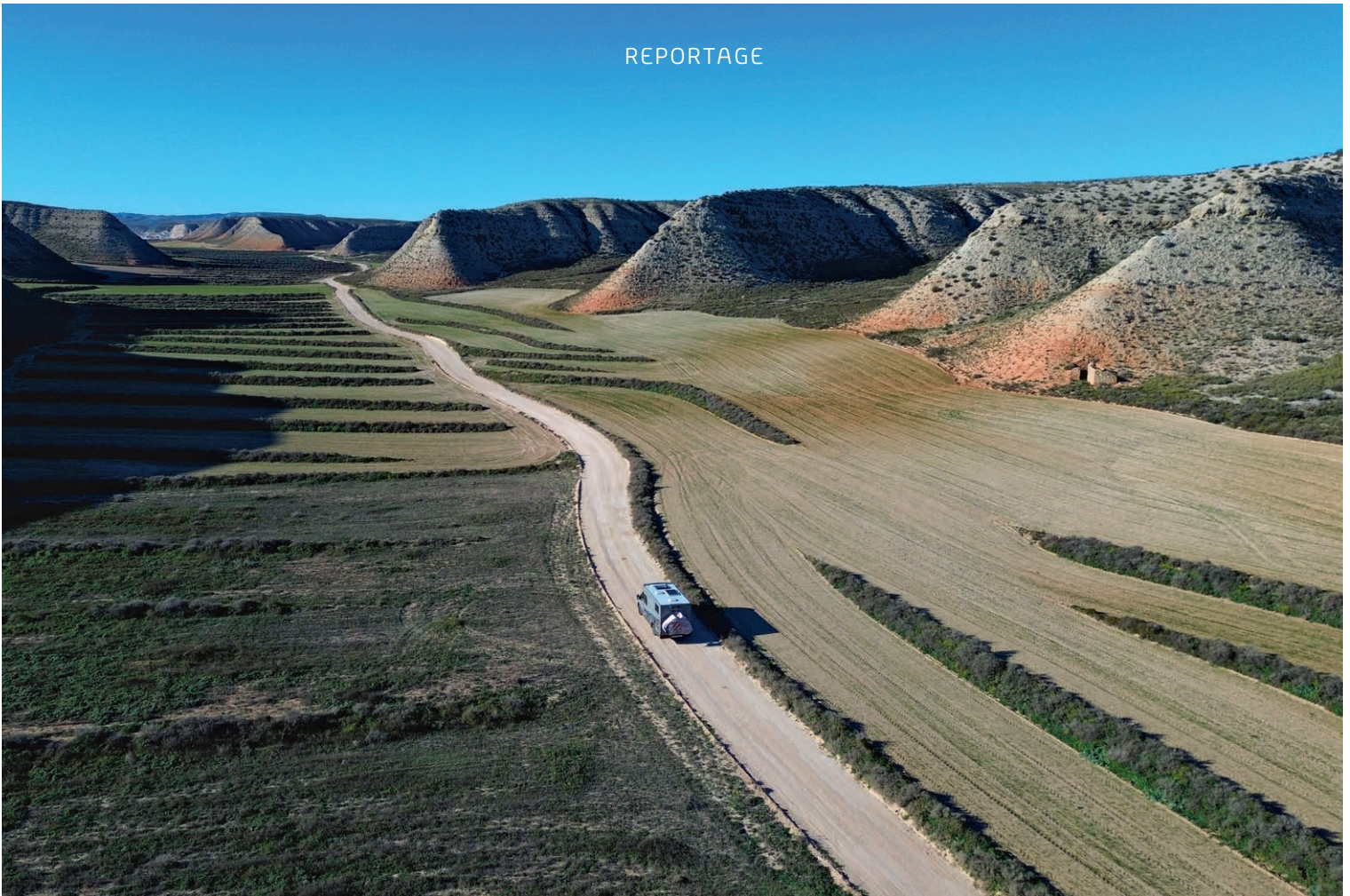
Die teilweise kargen Landschaften Spaniens schaffen es letztlich durch eine Vielfalt...