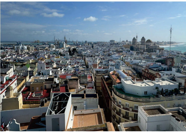
Cadiz bietet strahlend weisse Sandstrände, wunderschöne andalusische Gebäude und eine bewundernswerte Altstadt.