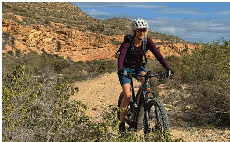
Unterwegs auf der Ruta de las Cares, dem Gesichter-Weg.