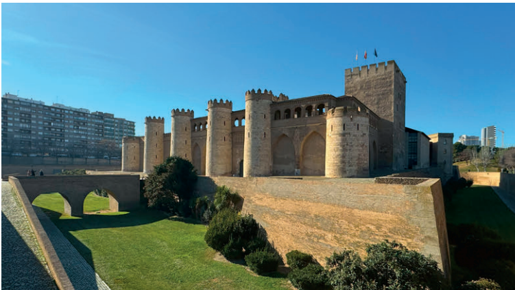
Der Aljafería-Palast wurde in der zweiten Hälfte des 11. Jahrhunderts als Residenz der saudischen Könige von Saraqusta in Saragossa erbaut.

EINDRUCKSVOLL PRÄSENTIERT SICH DIE BASÍLICA DEL PILAR IN SARAGOSSA. SIE IST DIE GRÖSSTE UND EINE DER WICH- TIGSTEN BAROCKKIRCHEN SPANIENS.