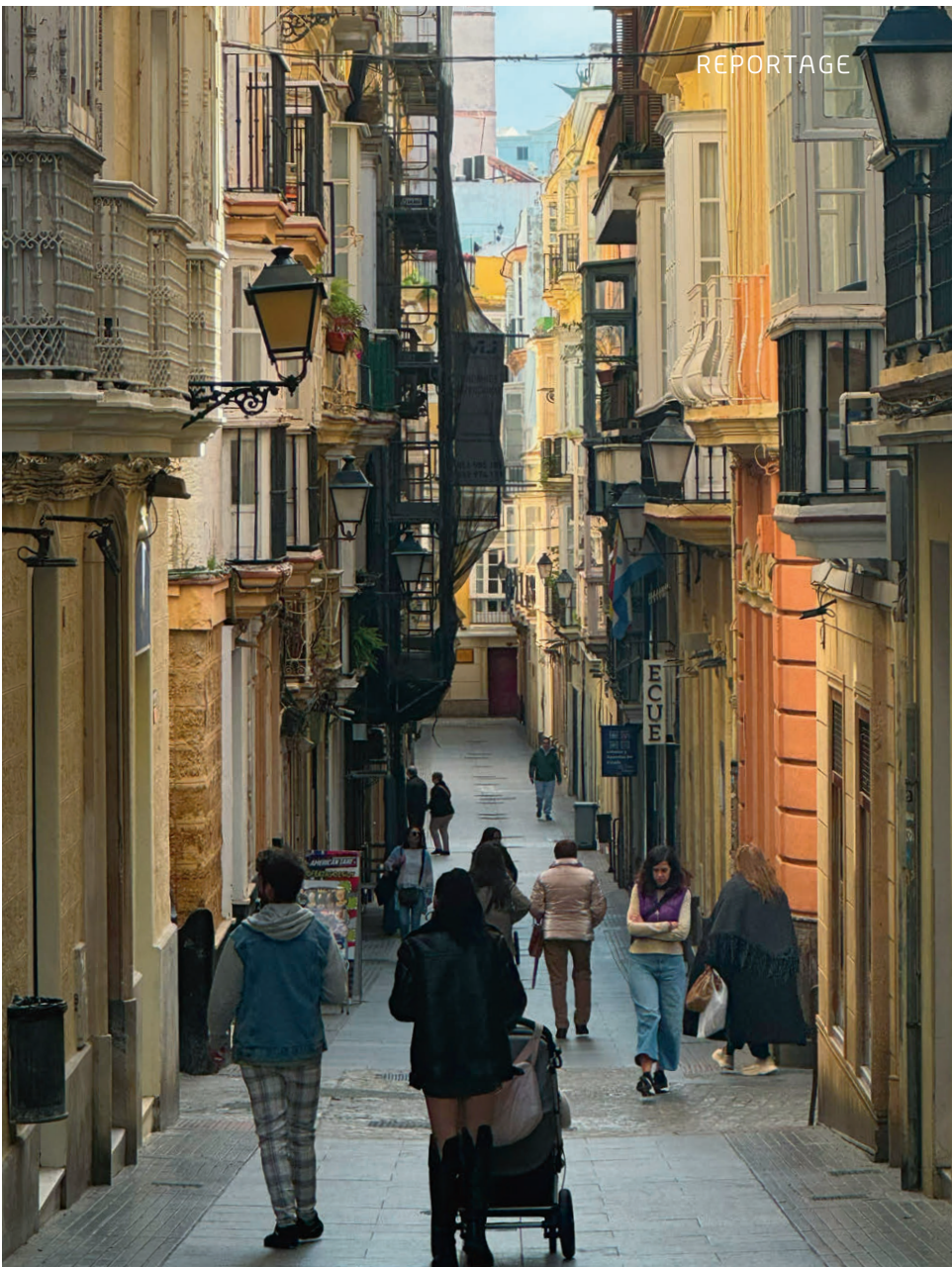
Flanieren und shoppen in den Strassen des alten Cadiz.