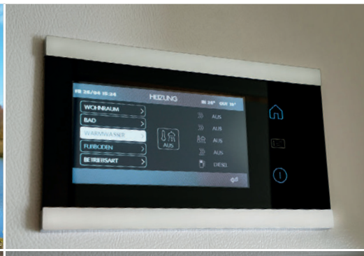
Steuerung der Zentralheizung/Fußbodenheizung