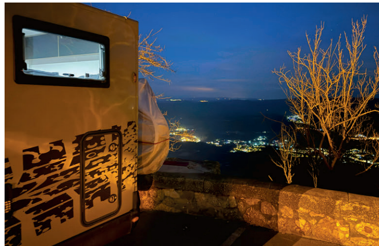
Wir geniessen den Stellplatz mit Aussicht beim Monastir Montserrat.

Spanien begeistert nicht nur landschaftlich, sondern auch kulinarisch mit grosser Vielfalt. In den Pyrenäen und der Sierra Nevada wärmen herzhaftere Eintöpfe wie die «Olla Aranesa» oder der «Puchero Andaluz». In Kastilien sind deftige Gerichte wie das «Cochinillo Asado» (Spanferkel) aus Segovia oder das «Judión de la Granja» (Riesebohneintopf) beliebt. Madrid ist bekannt für den kräftigen «Cocido Madrileño», ein Kichererbseneintopf mit Fleisch und Gemüse. Die Mittelmeerküste lockt mit frischem Fisch und Meeresfrüchten, während in Galicien Gerichte wie «Pulpo a la Gallega» (Tintenfisch mit Paprika und Kartoffeln) und «Caldo Gallego» (Grünkohleintopf) dominieren. Im Baskenland laden Pintxos – kleine, kunstvolle Happen – in den Tavernen zum Probieren ein.