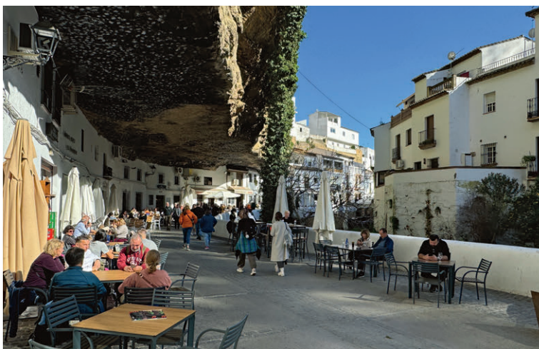
Beeindruckende Felsenstadt: Setenil de las Bodegas.