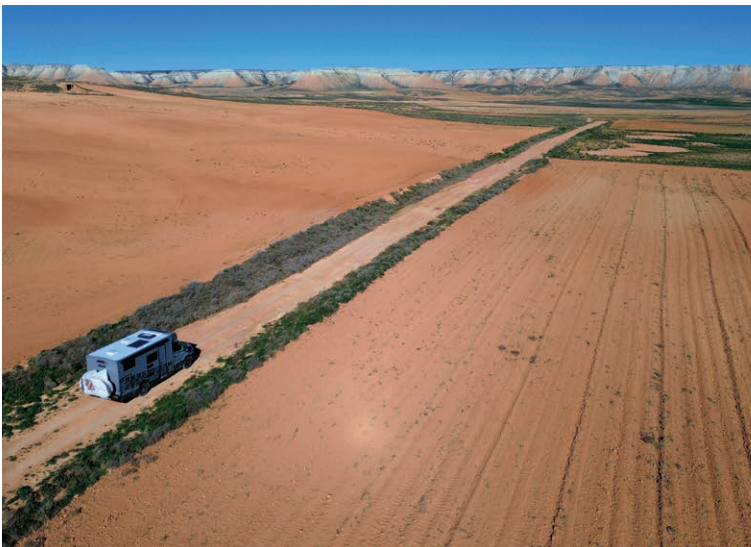
... an Variationen und unterschiedlichen Farbtönen...