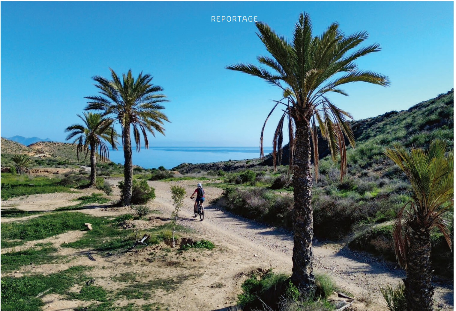
Traumhafte Bikerouten in der Sierra de las Moreras, in der es auch interessante Wanderrouten gibt.