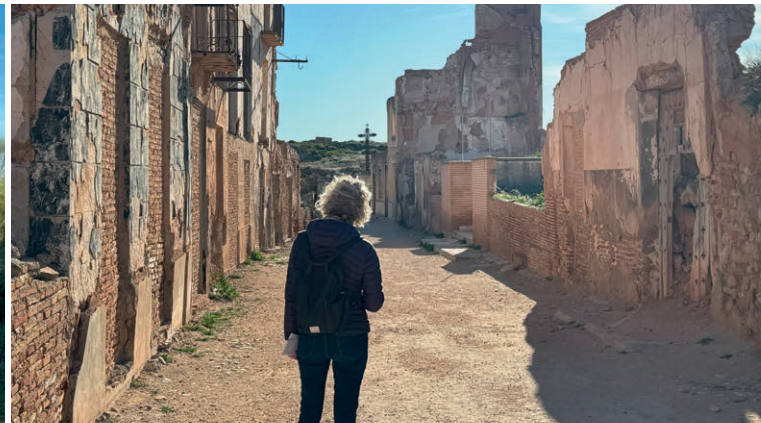
Mahnmal aus der Zeit Francos: Die Stadt Belchite wurde in der Schlacht von Belchite während des Spanischen Bürgerkrieges 1937 vollkommen zerstört.