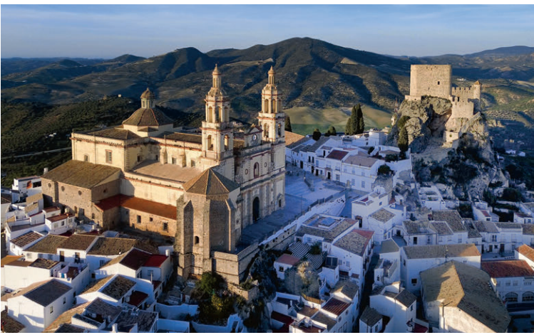
Olvera mit der Iglesia Nostra Señora de la Encarnacion und dem Castillo de Olvera.