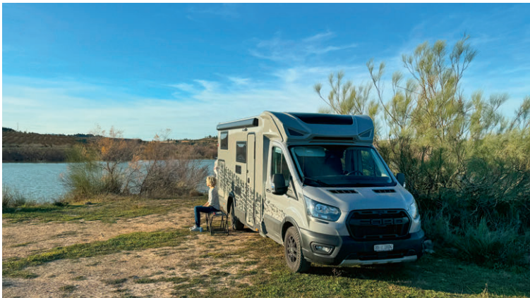
Wir finden einen idyllischen Übernachtungsplatz am Rio Ebro.