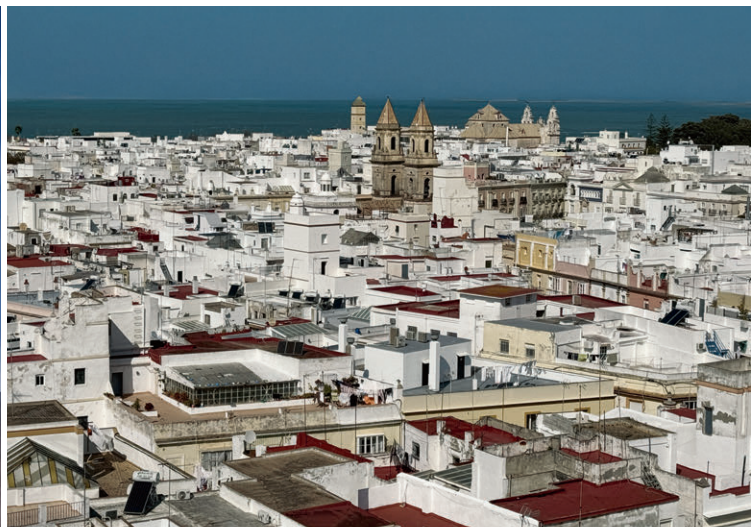
Blick über die Dächer von Cadiz aufs Meer.