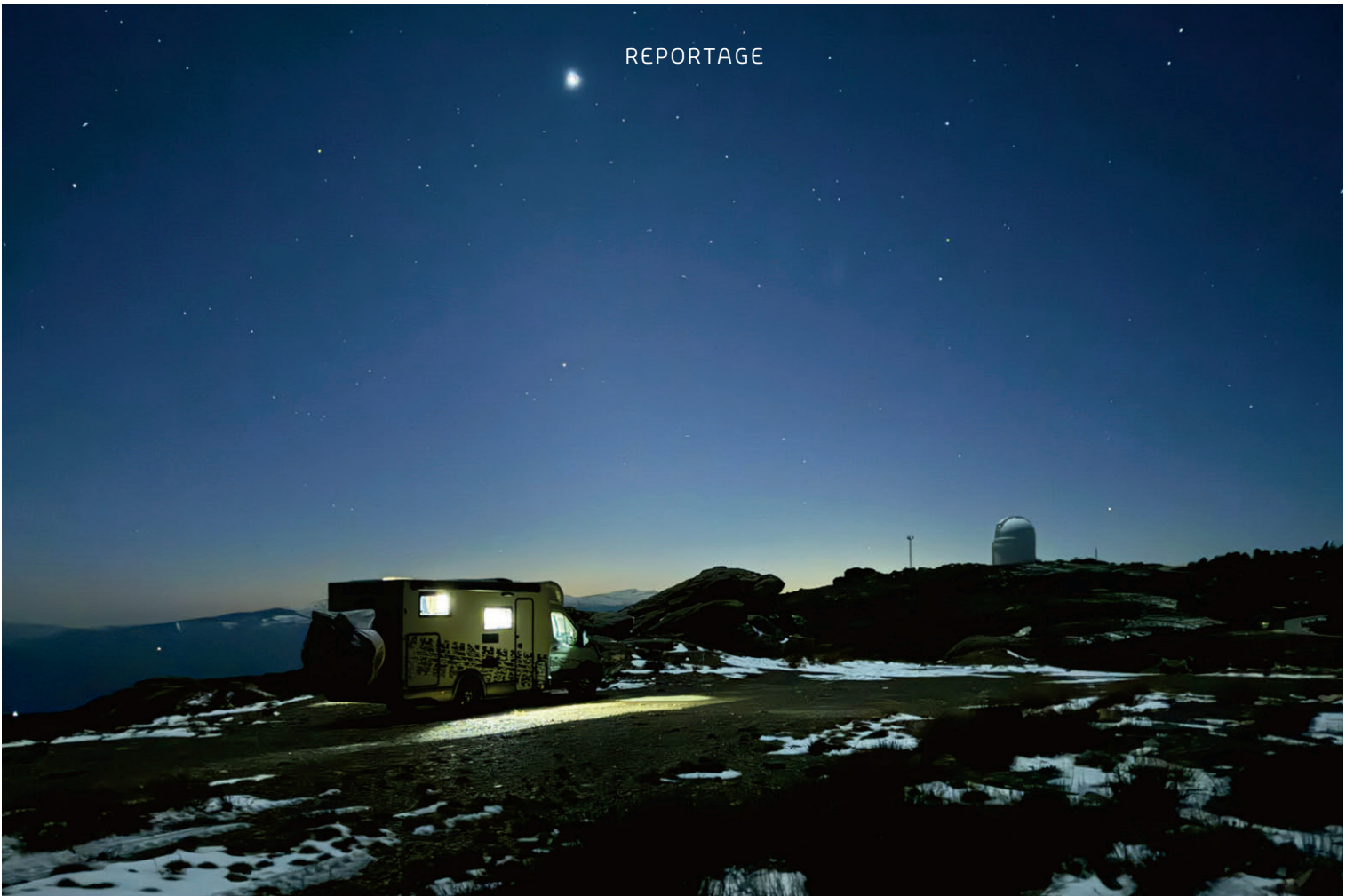
1000-Sterne-Hotel auf dem 2186 hohen Calar Alto.