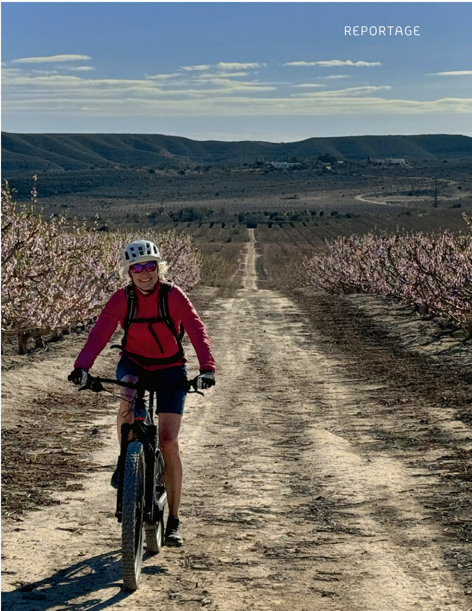
Mandelblüte in Andalusien. Zwischen Februar und März erblühen die Mandelbäume.