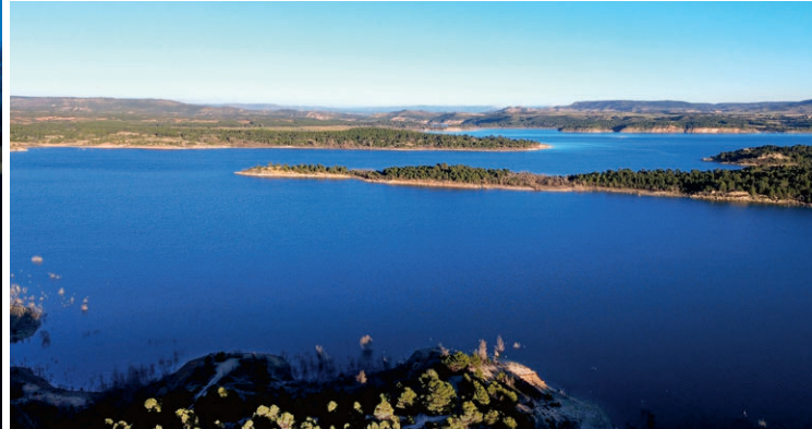
Der Blick auf die Küste vermittelt uns quasi einen Hauch von Skandinavien in Nordspanien.