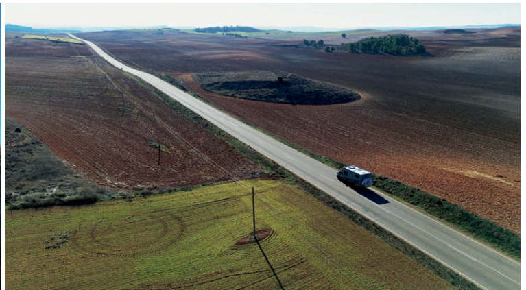
Das Gefühl, ganz alleine auf der Welt zu sein, kann bei der Fahrt durch dünn besiedelte Landschaft in Aragonien aufkommen.