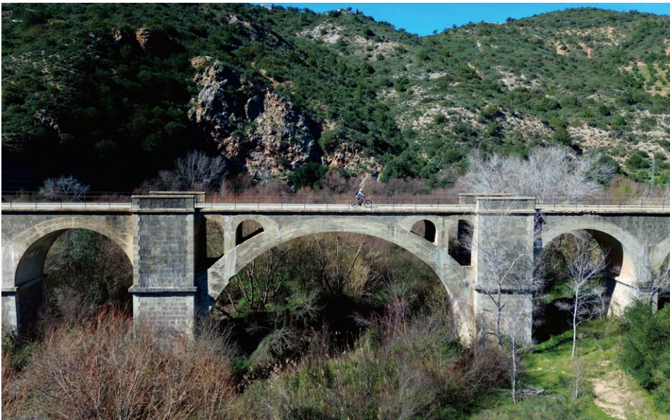
Via Verdes sind stillgelegte und für Fussgänger und Velofahrer nutzbare Eisenbahnlinien, die es in Spanien im ganzen Land gibt. Diese wurden nach dem Bau in den Dreissigerjahren des letzten Jahrhunderts gar nie in Betrieb genommen.