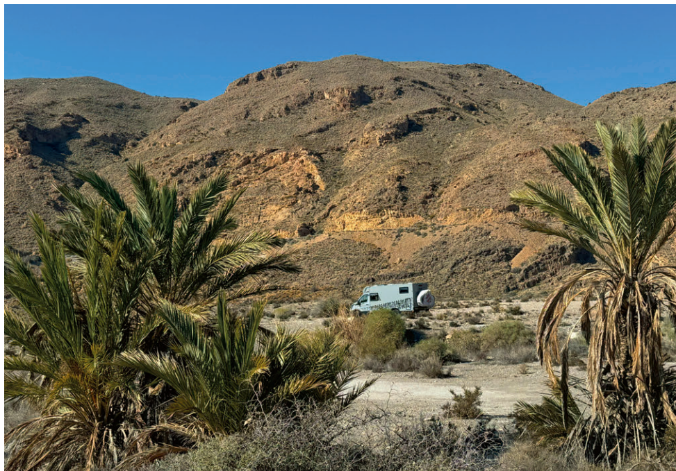
Stellplatz wie aus einer anderen Welt.

Eigentlich wollten wir zum Überwintern schon im Januar in Portugal sein. Doch für uns ist das Reisen nicht Mittel zum Zweck, um in möglichst kurzer Zeit ein definiertes Ziel zu erreichen. Wenn immer möglich bewegen wir uns abseits der bekannten Routen, ohne auf die Uhr und den Kilometerstand zu achten. Dabei entdecken wir immer wieder spannen-