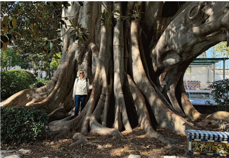
Der Parque Genovés, der botanische Garten der Stadt Cádiz, fasziniert mit über 100 Baumarten, vielen bunten Pflanzenbeeten, Schatten spendenden Palmengärten und diversen reizvollen Wasserspielen.

nichts oder auf Lateinisch «septem nihil», woraus sich später Setenil ergab.