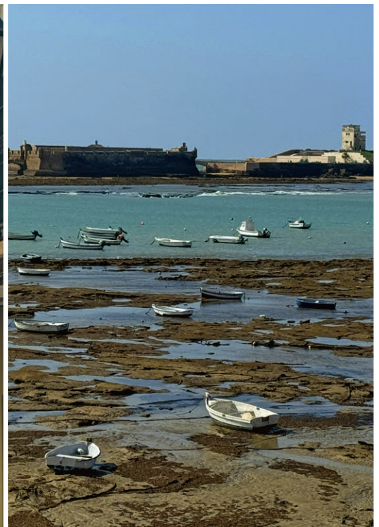
Von allen Seiten vom Meer umgeben war Cadiz früher eine wichtige Hafenstadt.

kann in rund einer Stunde gemütlich über einen gut ausgebauten Wanderweg oder über die Via Ferrata Castillo del Hierro erklimmen werden. Die Aussicht ist fantastisch und reicht bis nach Olvera, wo wir als Nächstes hinwollen. Von Olvera bis nach Puerto Serrano führt über 37 Kilometer eine bekannte Via Verde. Via Verdes sind stillgelegte und für Fussgänger und Radfahrer nutzbare Eisenbahnlinien, die es in Spanien im ganzen Land gibt. Die Gesamtdistanz besagter Strecke beträgt 119 Kilometer. Diese wurde nach dem Bau in den Dreissigerjahren des letzten Jahrhunderts gar nie in Betrieb genommen. Krass: Dutzende Tunnels, Viadukte und Bahnhöfe wurden demnach umsonst gebaut! Heute bieten viele solcher Strecken eine bequeme und attraktive Möglichkeit, das Hinterland zu Fuss oder mit dem Fahrrad zu erkunden. Die Tunnels sind meistens beleuchtet – ein Licht am Fahrrad