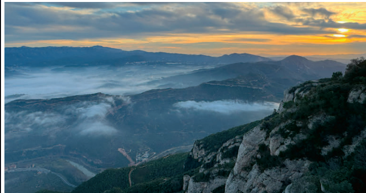
Morgenstimmung bei Benediktinerabtei Santa Maria de Montserrat, die auf 721 Metern Höhe im gleichnamigen Gebirge liegt.

Spanien bietet im Winter eine beeindruckende Vielfalt. In den Pyrenäen und der Sierra Nevada locken verschneite Gipfel und gut präparierte Pisten Skifahrer und Snowboarder an. Gleichzeitig herrscht an der Mittelmeerküste, besonders in Andalusien, ein mildes Klima, das perfekt für Stadtbesichtigungen und Wanderungen ist. Zentralspanien, mit Städten wie Madrid und Toledo, kann frostig werden, oft mit klarem Himmel und trockener Kälte. Im Norden hingegen bringen atlantische Tiefausläufer viel Regen, raue See und kräftige Winde. Ob Aktivferien oder entspanntes Sightseeing – Spanien zeigt sich auch im Winter als Land voller Möglichkeiten.