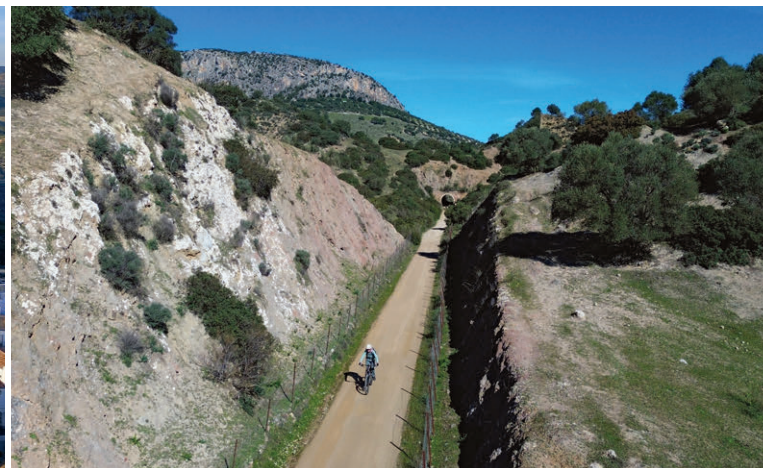
Unterwegs auf der Via Verde de la Sierra.

über dem Meer ist fantastisch. Die nächsten Tage verbringen wir in Agua Amarga auf einem Stellplatz. Vom schmucken Fischerdorf aus führt eine Via Verde ins rund 120 Kilometer entfernte Lucianena. Diese Eisenbahnlinie, deren Trasse heute grösstenteils als Fahrrad- oder Wanderweg genutzt wird, diente einst, um Eisenerz von den Schmelzöfen in der Sierra Alhamilla nach Agua Amarga zu transportieren und dort zu verschiffen. Auch