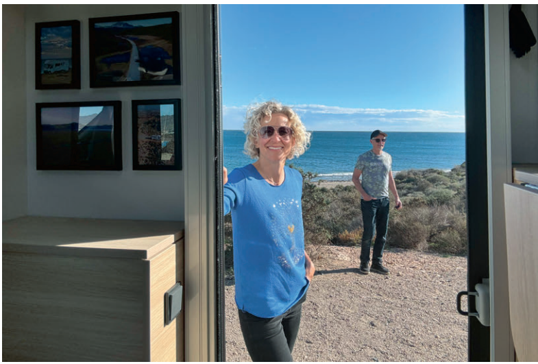
Letzter Stellplatz vor der Küste im Hinterland von Murcia.