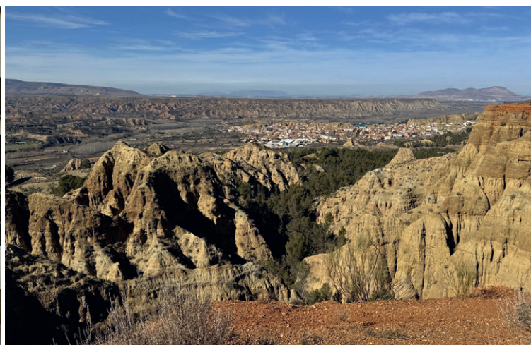
Ein Hauch von Bryce Canyon am Mirador de Marchal bei Guadix.

vielen Türmen ins Auge. Sie ist die grösste Barockkirche Spaniens. Die ebenfalls sehenswerte Aljferia beweist, dass die Mauren sich einst bis nach Nordspanien ausgebreitet hatten. Bei dieser «Mini-Alhambra» handelt es sich um einen arabischen Burg-Palast aus