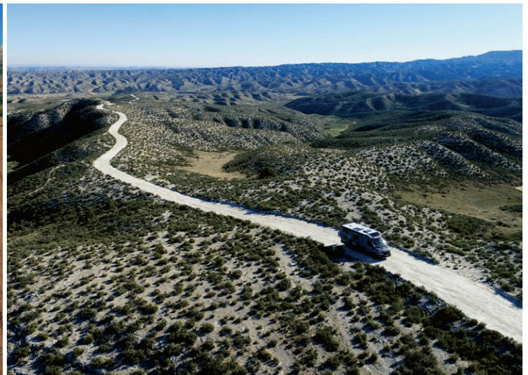
...uns immer wieder aufs Neue zu überraschen.

Es geht wieder los! Bereits zum vierten Mal folgen wir den Zugvögeln und verbringen den Winter im sonnigen Süden. Aber nicht in Griechenland, wie ursprünglich vorgesehen, sondern zum ersten Mal in Portugal. Wetter- und niederschlagsmässig schneidet die Iberische Halbinsel in den Wetterstatistiken im Winter besser und vor allem «trockener» ab als Griechenland. Und da wir nicht wissen, ob unser