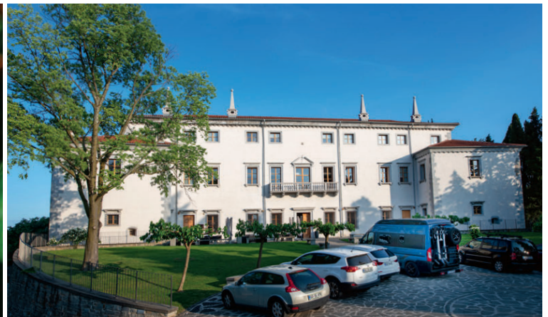
Die Villa Vipolže mit venezianischen Zimmern aus dem 16. Jahrhundert.