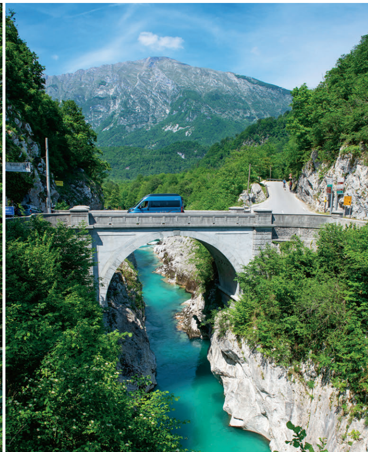
Die Napoleonbrücke bei Kobarid wurde im Laufe der Jahrhunderte mehrfach erneuert.