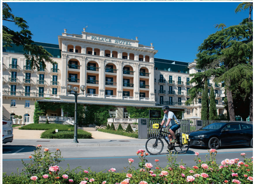
Oben: Idyllischer stehen wir im Kamp Lucija. Unten: Das Palace Hotel von Portoroz verströmt mondänen Chic.

«handgemachtes» Meersalz ein schönes Souvenir. Zurück geht es am Meer entlang, mit einer ausgedehnten Pause in der Beach Bar von Portorož. Dort stehen schon Dutzende Räder – kein Wunder. Der Meereszugang ist mit leicht abfallendem Kies perfekt, aus der Open-air-Küche duftet es verführerisch und die Drinks funkeln im Sonnenlicht. Der handgemalte Millemarker verkündet noch vier Kilometer nach Piran, das scheint machbar.