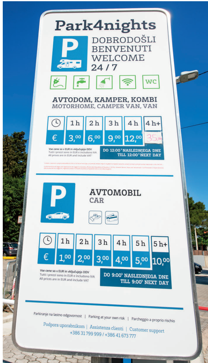
Der städtische Parkplatz bei Portoroz bietet Campern auch Stellplätze.