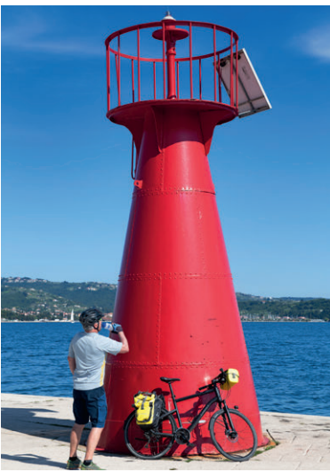
Der Leuchtturm bei Portoroz.