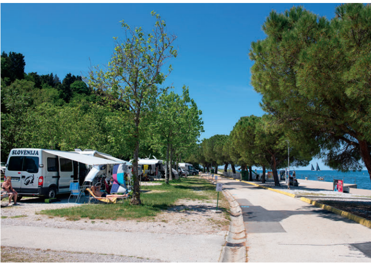
Zwischen Portoroz und Piran gibt es etliche Campingplätze wie Camping Fiesa mit direktem Zugang zum Meer.