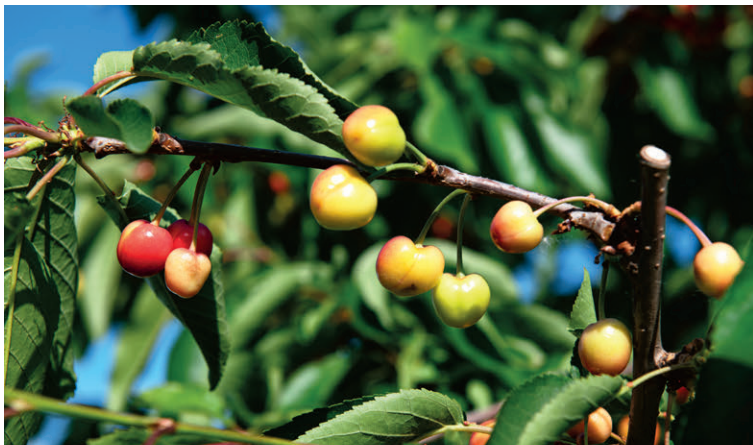
Die Brda ist berühmt für ihre herrlichen Kirschen.

BLICK ÜBER DIE WEINREGION UND DIE BURG VON DOBROVO.