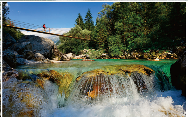
Zwischen Bovec und Trenta führen die Wander- und Fahrradrouten öfter über die Soca.