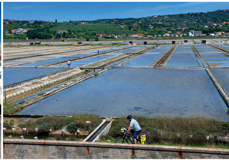
Radtour entlang den Salinen von Secovlje.

Am nächsten Tag gönnen wir unserem Wohnmobil eine Pause und nehmen die Räder. Piran ist ohnehin autofrei, das heisst, wir müssten auf einen kostenpflichtigen Parkplatz ausweichen, der uns kaum näher an das Zentrum brächte. Somit erkunden wir auf der 13 Kilometer langen Salzroute erst mal die Umgebung: Der vorbildlich beschilderte Radweg