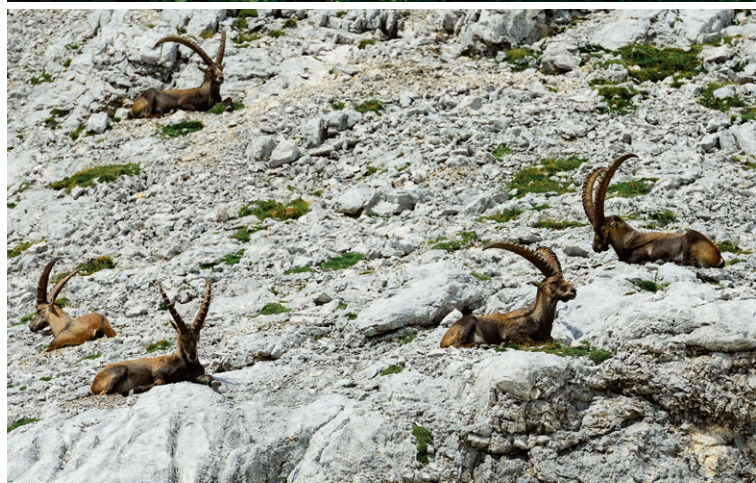
Auf der Wanderung zum Gipfel des Mangart begegnen uns kapitale Steinböcke.

VOM LAGO PREDIL FÜHRT EINE STEILE RAMPE HOCH IN DIE JULISCHEN ALPEN UND ZUM MANGART-SATTEL.