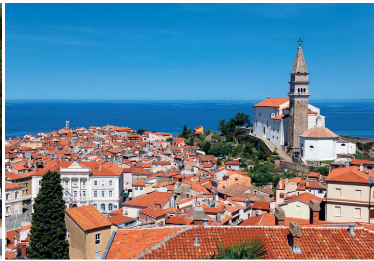
Von der Burg Piran reicht der Blick über die Stadt weit auf die Adria hinaus.

Beach» entwickelt. Wir folgen der Route 203 bis zum Abzweig Podclopča. Von dort geht es auf einem neu errichteten und mittlerweile gut beschilderten Wanderweg für 4,5 Kilometer durch den Wald. Hier errichtete Hollywood eine haarsträubende Hängebrücke für den dreiteiligen Kassenschlager «Die Chroniken von Narnia». Die Brücke ist längst