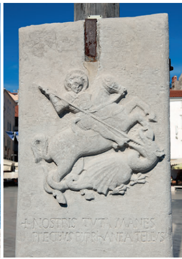
Der heilige Georg ziert das Wappen von Piran.