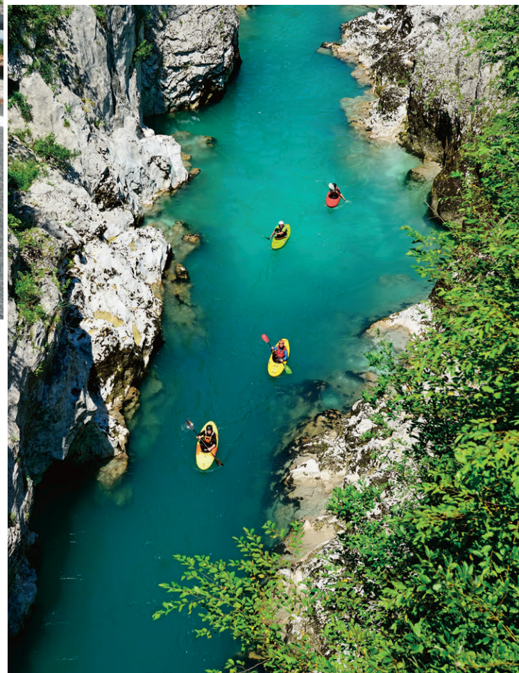
Die Soca ist ein Traumrevier für Kanuten.

Slowenien ist mit 20273 Quadratkilometer Fläche gerade mal halb so gross wie die Schweiz. Es liegt am Südostrand der Alpen und grenzt im Norden an Österreich, im Westen an Italien, im Nordosten an Ungarn und im Osten und Süden an Kroatien. Das Land besteht in weiten Teilen aus Gebirge (Alpen, Alpenvorland, Hügelland, Karst). Höchster Berg ist der Triglav in den Julischen Alpen mit 2864 Meter. Fast 60% der Landesfläche ist von Wäldern bedeckt. In den slowenischen Wäldern sind sogar Wölfe, Wildkatzen und Braunbären zu Hause.