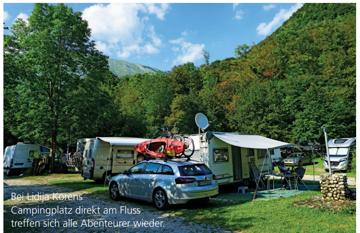
Bei Lidija Korens Campingplatz direkt am Fluss treffen sich alle Abenteurer wieder.