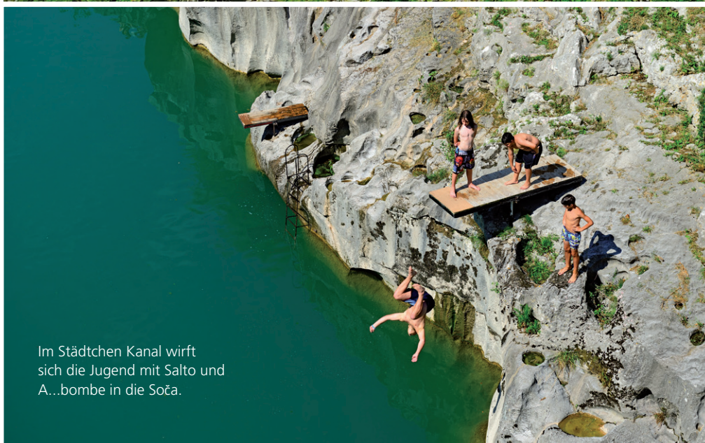
Im Städtchen Kanal wirft sich die Jugend mit Salto und A...bombe in die Soča.