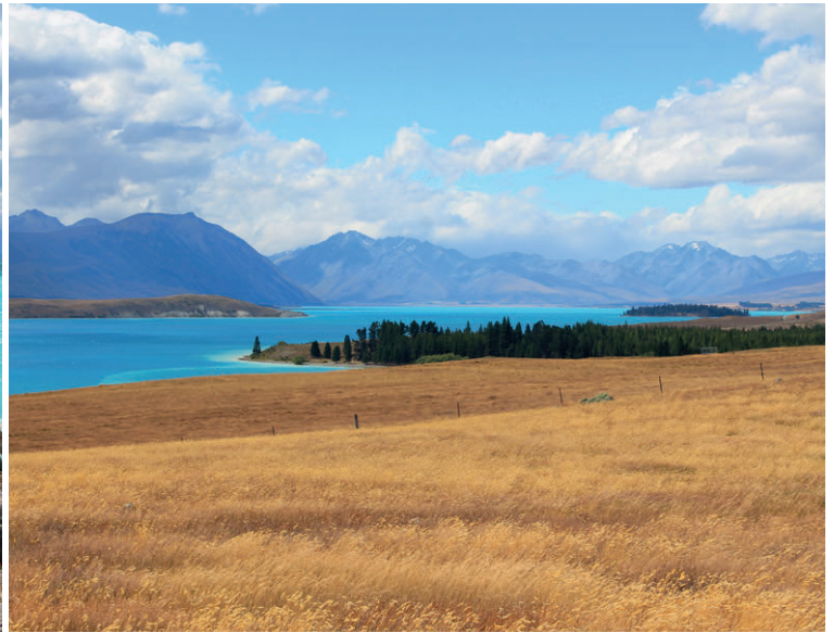
Die Seen der Südinsel leuchten schon von Weitem mit ihren türkisfarbenen Wellen zwischen den Tussockgrashügeln. Links: Lake Pukaki, rechts: Lake Tekapo.