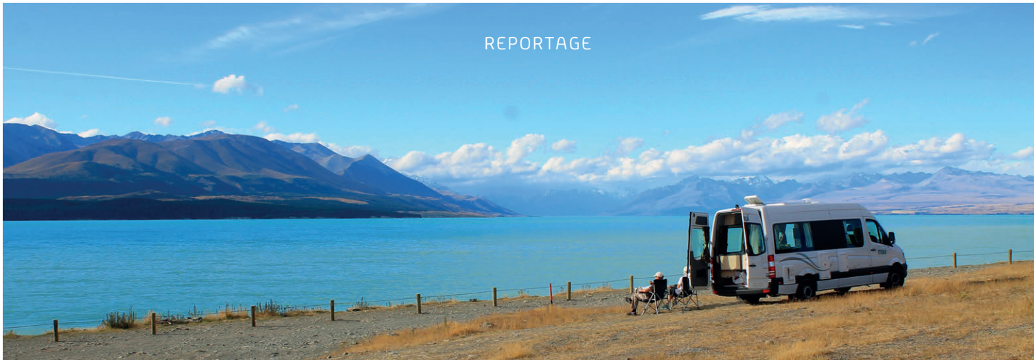
Am Lake Pukaki übernachteten wir mit Blick auf den See und den Mount Cook, Neuseelands höchsten Berg.

alles, was ein Touristenherz höherschlagen lässt und in den gemütlichen Cafés und Restaurants lässt es sich verweilen. Auch ist das Städtchen ein idealer Ausgangspunkt für die Erkundung der vielseitigen Umgebung mit seinen zahlreichen Aktivitätsmöglichkeiten auf dem Wasser und in der weiten Natur. Von Wanaka ist es ein Katzensprung über die lohnenswerten, historische Cardrona Valley Road ins quirlige Queenstown. Während in Wanaka alles etwas beschaulicher zu und hergeht,