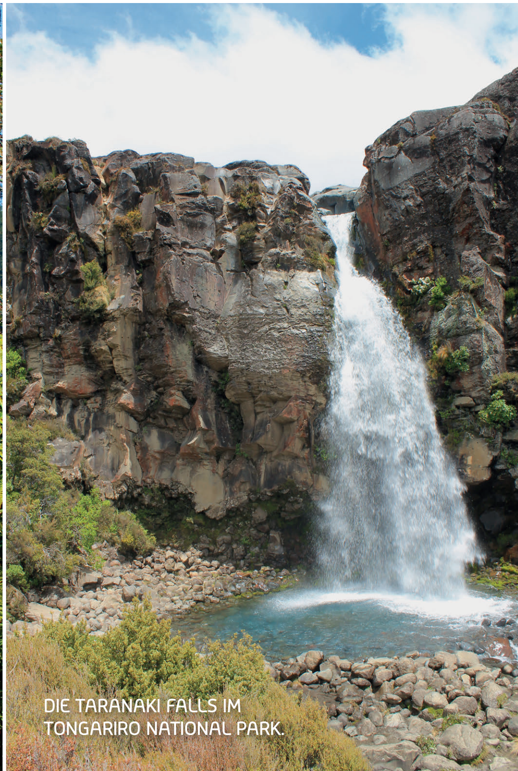
DIE TARANAKI FALLS IM TONGARIRO NATIONAL PARK.

Der Sommer dauert in Neuseeland von Dezember bis Februar. Im neuseeländischen Sommer zeigt das Thermometer oft 20 bis 30 °C an und auch das Wasser erreicht Temperaturen, die sich ideal zum Baden oder für unterschiedliche Wassersportarten eignen. Der Sommer in Neuseeland gilt als regenärmste und sonnigste Zeit des Jahres.