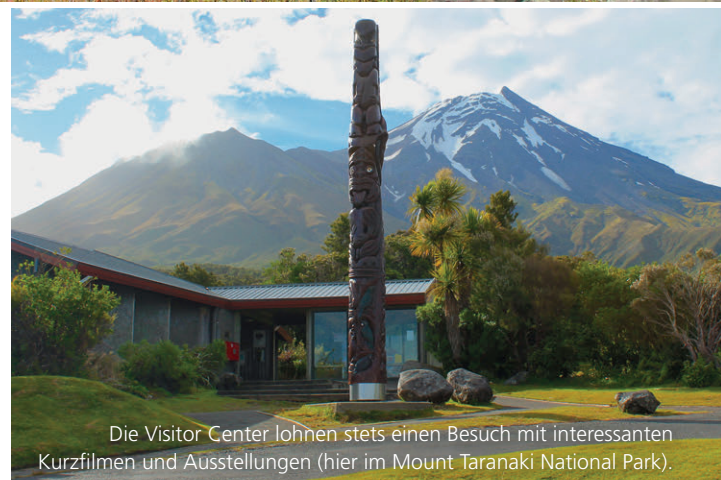
Die Visitor Center lohnen stets einen Besuch mit interessanten Kurzfilmen und Ausstellungen (hier im Mount Taranaki National Park).

Die Mietpreise der Wohnmobile sind hoch – selbst für einfach eingerichtete Fahrzeuge bezahlt man relativ viel. Auch wenn eine Einwegmiete von Auckland nach Christchurch oder umgekehrt teurer ist, lohnt es sich, eine Einweg-Route festzulegen, um Zeit zu sparen. Auch lassen sich die schönsten Orte der beiden Inseln so gut miteinander verbinden. Nehmen Sie sich nicht zu grosse Etappen vor – Neuseelands kurvenreiche Strassen nehmen viel Zeit in Anspruch und oftmals braucht man für kurze Strecken deutlich länger als in der Schweiz.