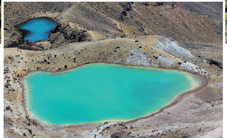
Der berühmteste Wanderweg Neuseelands, der Tongariro Crossing im gleichnamigen National Park, führt am erloschenen Vulkan Ngauruhoe und den leuchtend blauen Emerald Lakes vorbei.