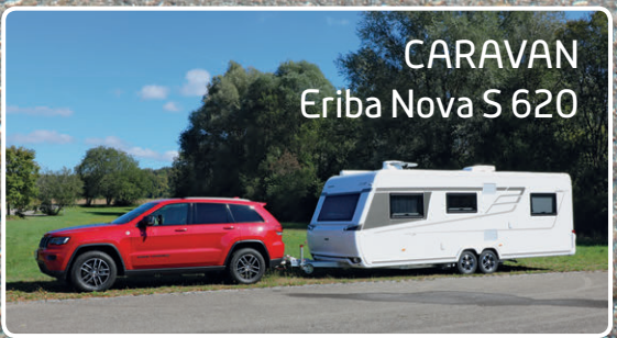
CARAVAN Eriba Nova S 620