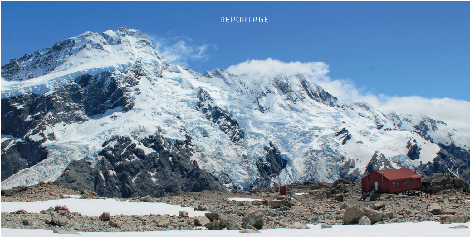
Die Miller Hütte im Aoraki/Mount Cook National Park bietet Gletscherpanorama vom Feinsten – und steht am Fuss von Sir Edmund Hillarys erstem Gipfel.