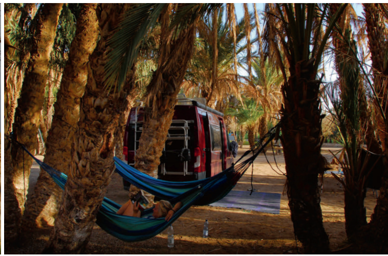
Chillen unter Palmen – Oasenruhe für Reisende.

der eindrucksvollsten Wahrzeichen der marokkanischen Stadt Meknès und ein Juwel des gesamten Landes. Dieses architektonische Meisterwerk, das Teil der kaiserlichen Stadt Moulay Ismails ist, wurde 1996 in die Liste des UNESCO-Weltkulturerbes aufgenommen und zieht bis heute Besucher aus aller Welt in seinen Bann. Die orientalisch Altstadt, deren Wurzeln bis ins 10. Jahrhundert zurückreichen, erlebte im 18. Jahrhundert ihre glanzvolle Blü-