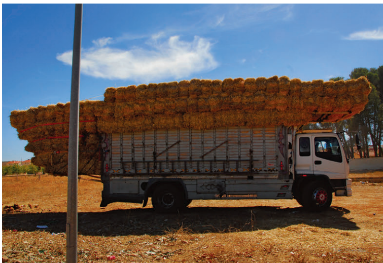
Leicht überladene LKWs – ein gewohntes Bild auf Marokkos Strassen.