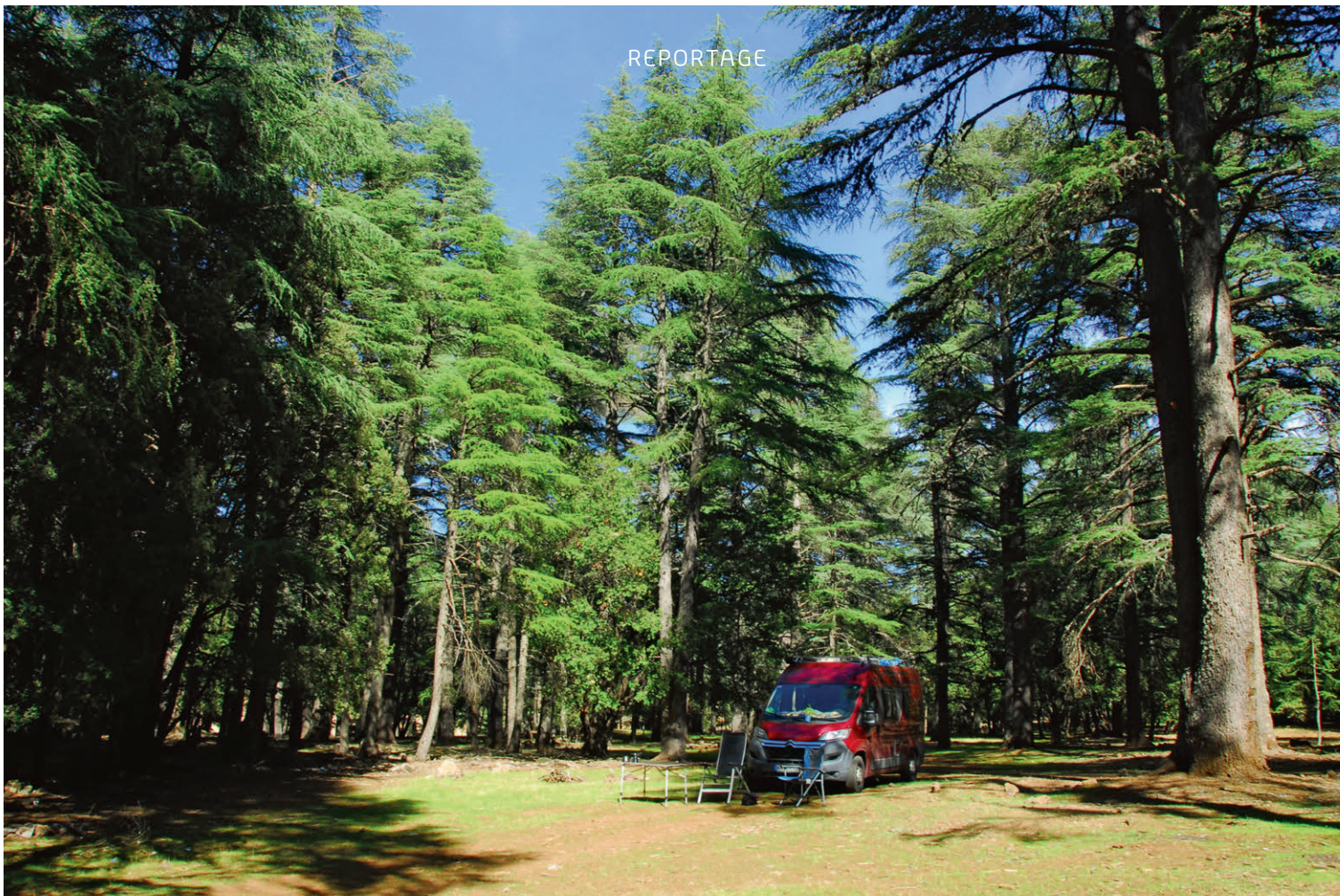
Stellplatz in den Zedernwäldern bei Azrou – ein Naturparadies für Ruhesuchende.