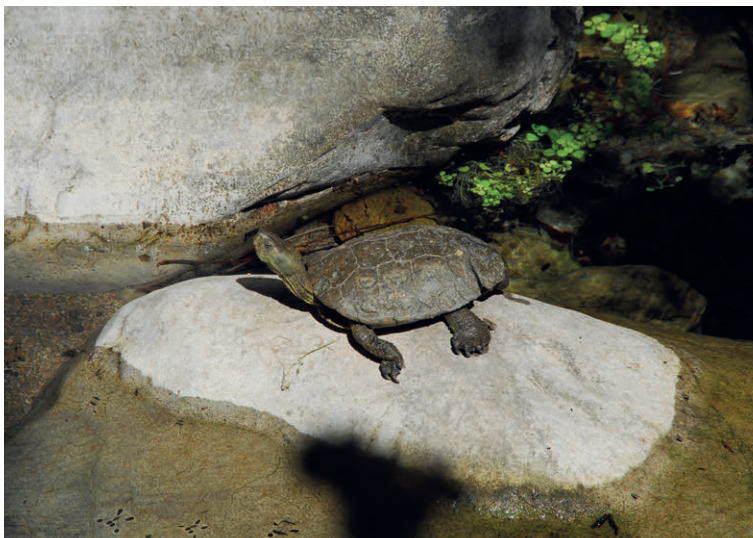
Friedliche Bewohner: Schildkröten im Fluss El Kelaa bei Akchour.