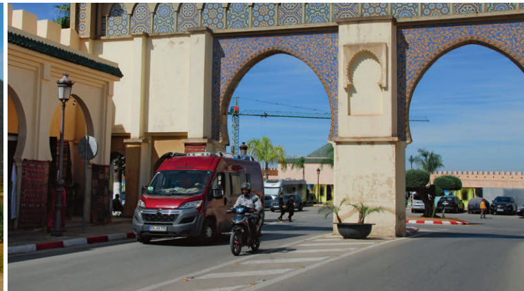
Prachtstrassen in Meknès – ein Zeugnis der einstigen Königsstadt.