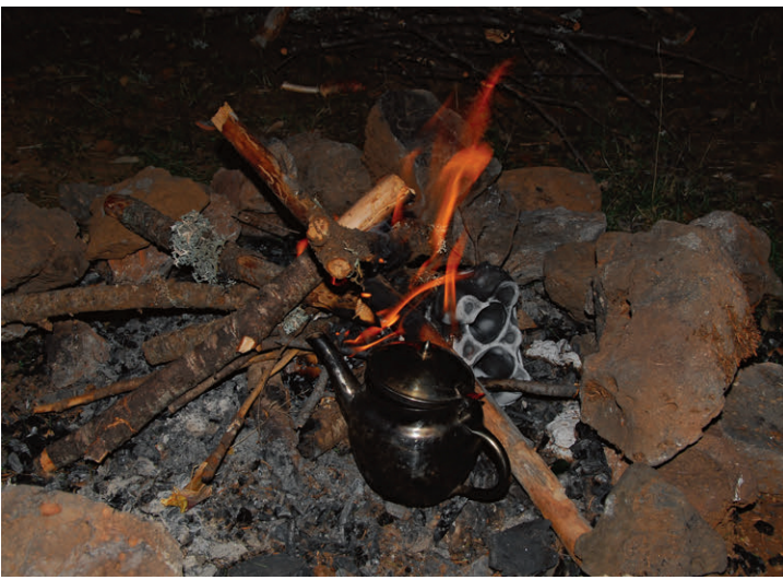
Abendliches Lagerfeuer in den Zedernwäldern – traditioneller Tee in gemütlicher Atmosphäre.