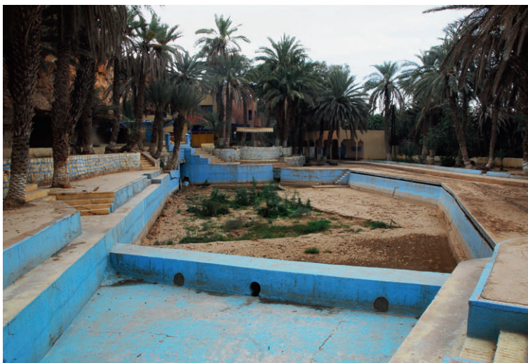
Staub, wo früher die Source Bleue sprudelte – ein Mahnmahl des Wassermangels.