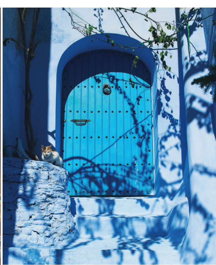
In Chefchaouen gehen Influencer und Instagrammer aus der ganzen Welt auf Fotojagd.