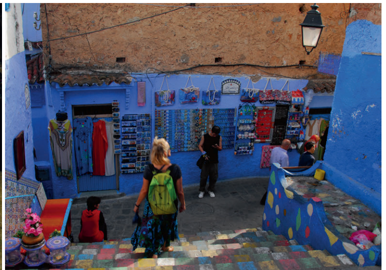
Die blaue Stadt Chefchaouen – ein leuchtendes Labyrinth am Fusse des Rif-Gebirges.