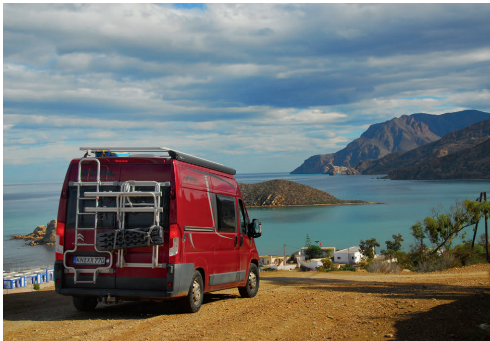
Kalah Iris am Mittelmeer: Ein abgelegener Ort mit faszinierender Küstenlandschaft.

Der kleine Fischerort liegt am Rande des Al-Hoceima-Nationalpark und ist Beispiel für die Korruption im Land. Aufgrund der wunderschönen Lage sollte hier eine touristische Infrastruktur aufgebaut werden, aber leider wurden Millionen von Dollar Investitionsgelder veruntreut und verschwanden in irgendwelchen dunklen Kanälen. Geblieben ist ein über den Klippen liegender Campingplatz