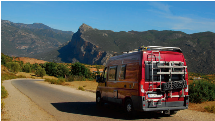
Hanffelder, so weit das Auge reicht – die grünen Landschaften des Rif-Gebirges.