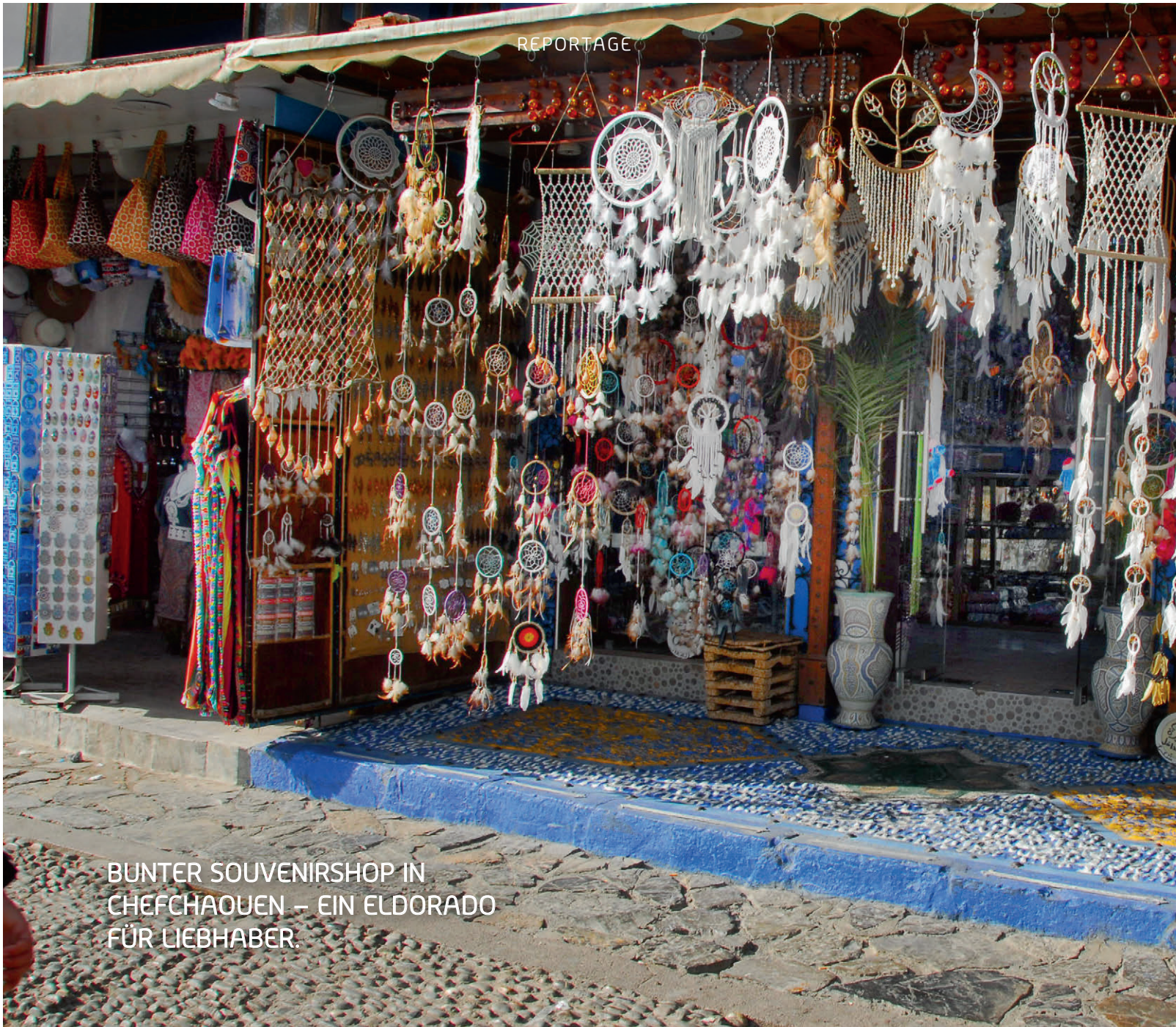
BUNTER SOUVENIRSHOP IN CHEFCHAOUEN – EIN ELDORADO FÜR LIEBHABER.