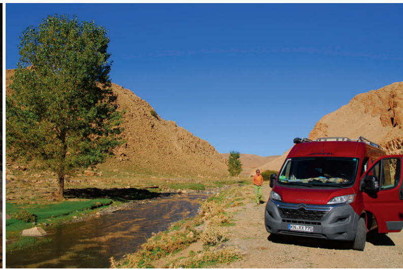
Wunderschöne Stellplätze an Bachläufen im Atlasgebirge – ein Traum für Naturfreunde.

sende folgten. Diese werden in jüngster Zeit nochmals um die Influencer und Instagrammer ergänzt, die auf der Jagd nach schönen Fotomotiven die schmucke Stadt aufsuchen. Oberhalb der Stadt finden wir für ein paar Tage auf dem netten Campingplatz einen schönen Platz unter Pinienbäumen. Die Medina, ganz in Hellblau eingefärbt, hat einen besonderen Charme. Sie besteht aus einem arabischen