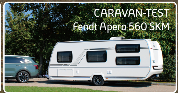
CARAVAN-TEST Fendt Apero 560 SKM