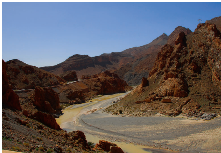
Entlang des Canyon Gargantas im Atlasgebirge – atemberaubende Schluchtenlandschaft.

Wir haben mit der ersten Fähre vom spanischen Festland an die nordafrikanische Küste ins spanische Ceuta übergesetzt und sind schon bei Sonnenaufgang an der Grenze nach Marokko. Aus den Erfahrungen früherer Reisen haben wir rund zwei Stunden für den Grenzübertritt eingeplant und sind umso überraschter, dass wir nach knapp 20 Minuten schon alles hinter uns haben und die Reise