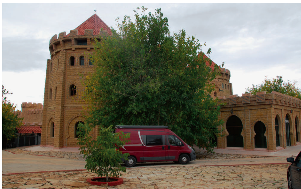
Edelcamping bei Azrou – luxuriöses Campen mitten in der Natur.

In den nächsten Tagen geht unsere Fahrt durch das Rifgebirge gen Mittelmeerküste. In den 80er-Jahren war dies eine durchaus gefährliche Tour für Touristen. Das Rifgebirge, landschaftlich wunderschön, war Zentrum des Drogenanbaus und -handels. Touristen wurden gerne einmal angehalten und gegen deren Willen zum Schmuggeln genötigt. Diese Zeiten sind vorbei, man kann gefahrlos durch den Norden Marokkos reisen. Unser Problem in der heutigen Zeit ist das Navi. Es zeigt uns durch das Gebirge einen Weg an, welcher immer kleiner wird und auf einer Lehmstraße endet. Zu allem Stress auf der schmalen Piste fängt es leicht an zu regnen, die Piste wird im-