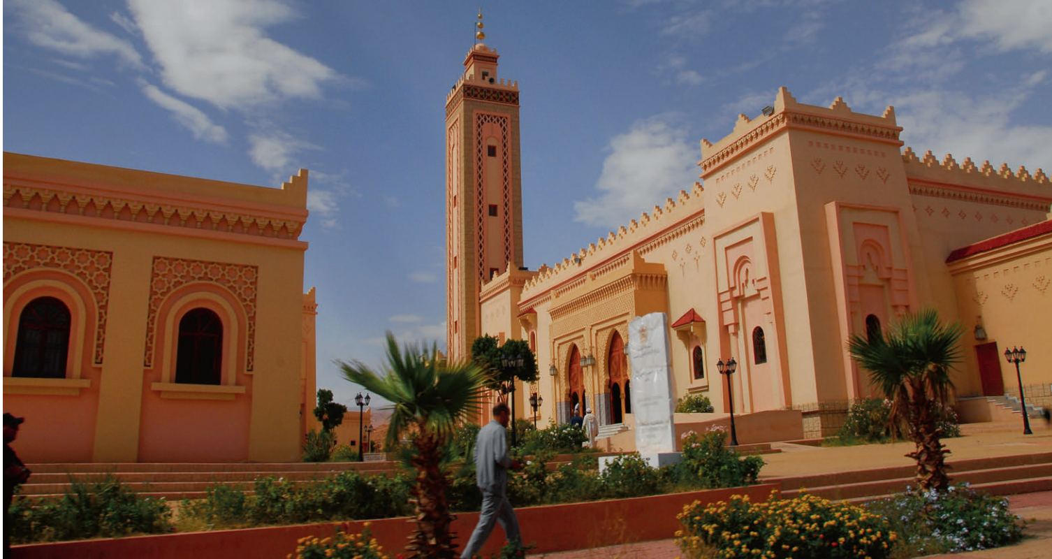
Der Königspalast in Meknès – ein Ort voller Geschichte und Schönheit.