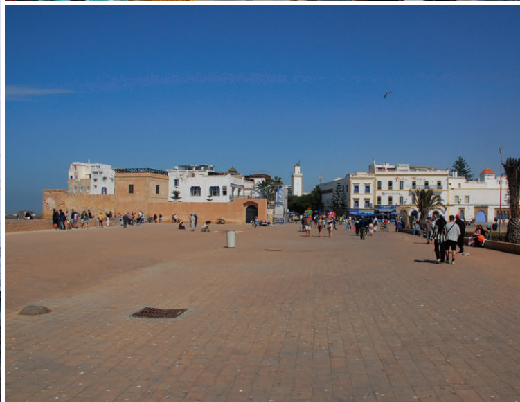
Ungewöhnlicher, aber äusserst praktischer, zentrumnaher Stellplatz für das Wohnmobil in Essaouira.