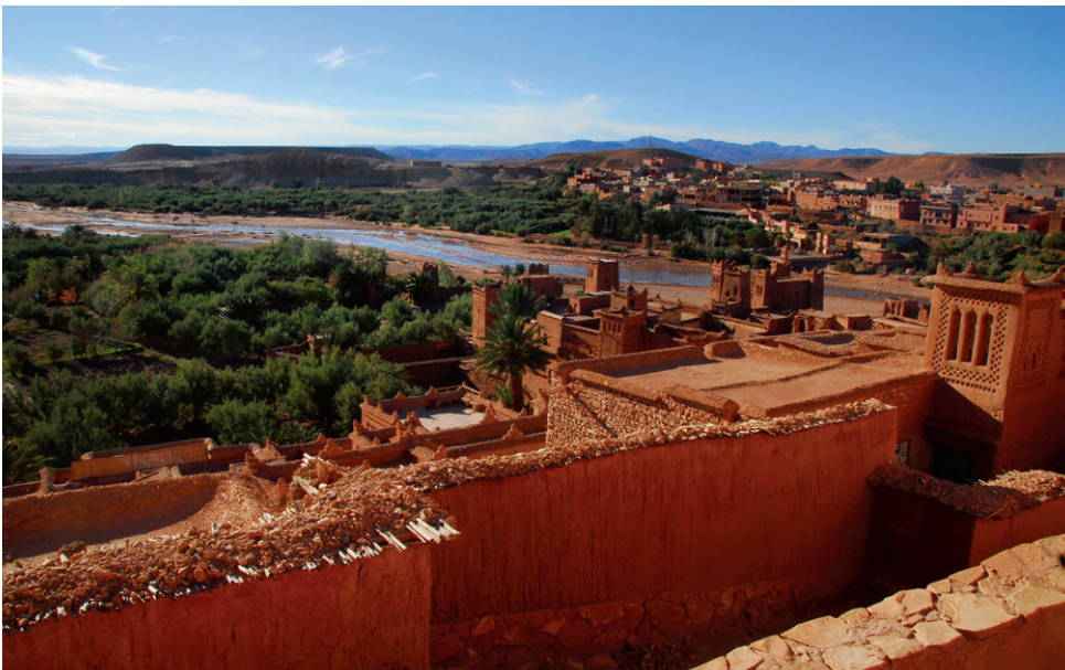
Die wunderschöne Oase Ait Benhaddou – Filmkulisse und UNESCO-Weltkulturerbe.