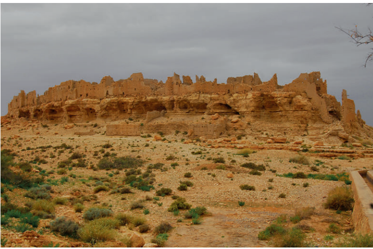
Kasbah Meski – ein historisches Juwel oberhalb des Ziz-Tales.