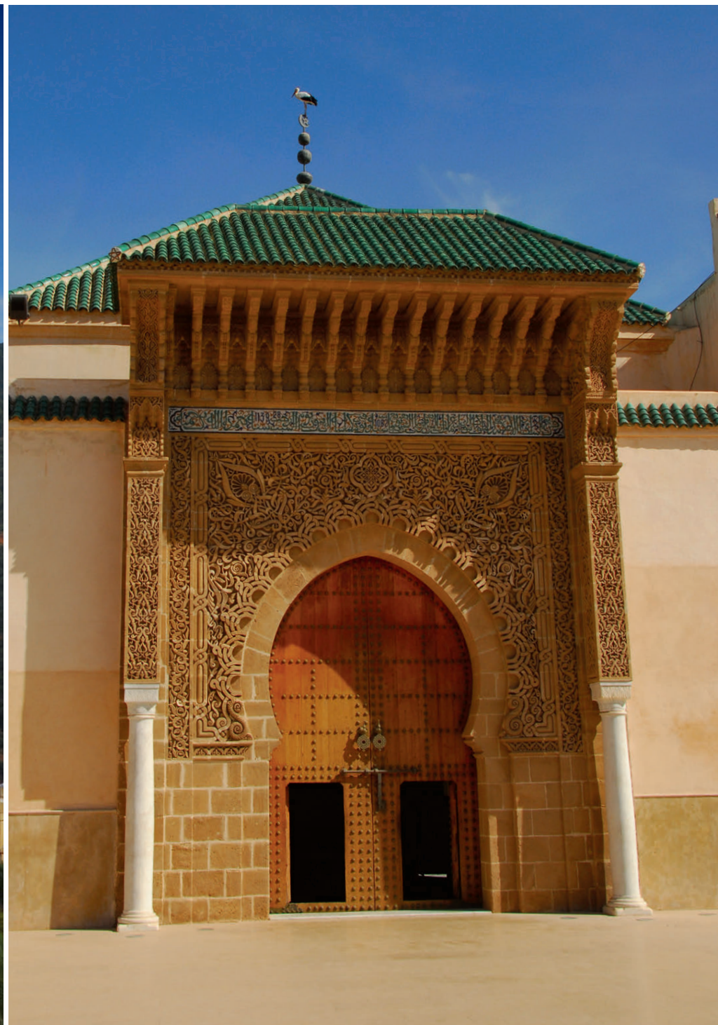
Der prächtige Eingang zum Königspalast in Meknès – ein Meisterwerk islamischer Baukunst.