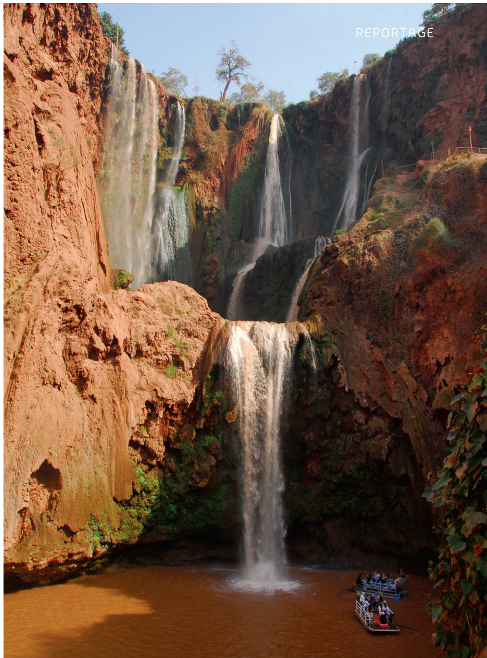
Die wunderschönen Wasserfälle von Ouzoud – ein spektakuläres Naturschauspiel.