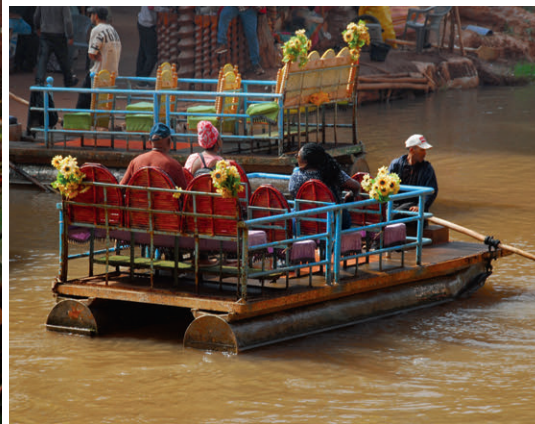
Mit dem Floss direkt an die Wasserfälle – hautnahes Erlebnis in der Gischt.

massen herab, um in grosse Becken zu fallen. Dann fließen sie in weiteren kleinen Fällen talabwärts. Schaut man sich das Spektakel an, sollte man unbedingt festes Schuhwerk und Badekleider mitnehmen, um eine kleine Wanderung talabwärts zu unternehmen, und später in den kleinen Wasserbecken ein kühles Bad nehmen. Ein Traum!