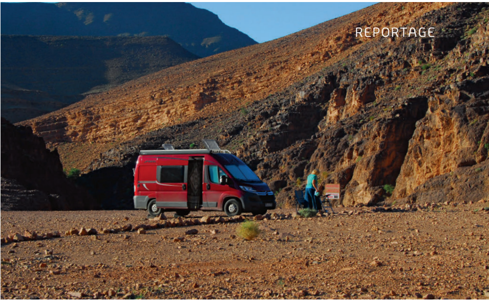
Wüstenstellplatz bei den Cascade de Tizgui nahe dem Draa-Tal – Einsamkeit inmitten atemberaubender Natur.