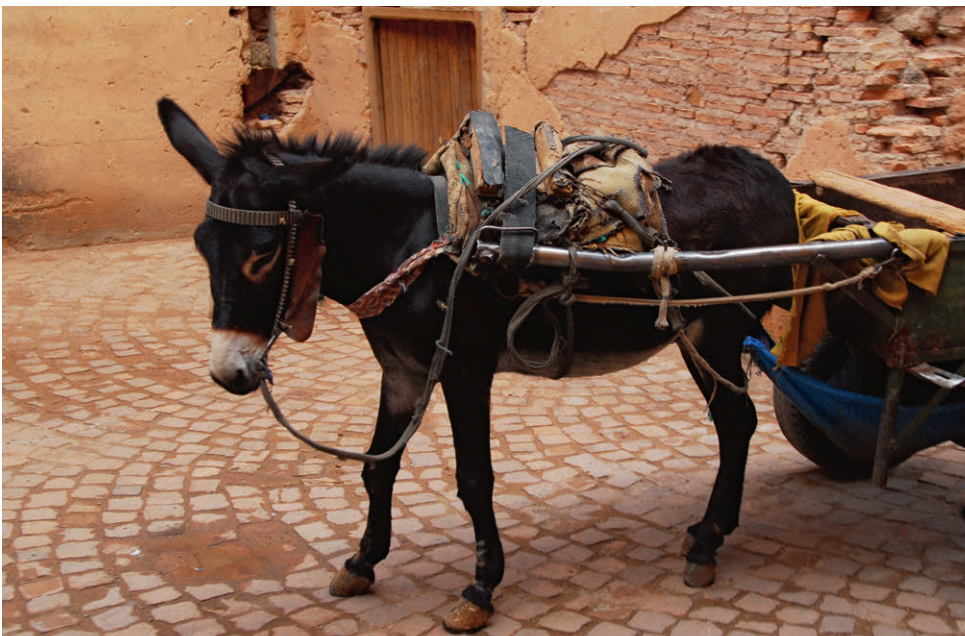
Lastenesel in Marrakesch – treue Begleiter im Altstadttrubel.

Wir streunen den ganzen Tag durch das Treiben und sind abends vollkommen erschöpft von den ganzen Reizen.