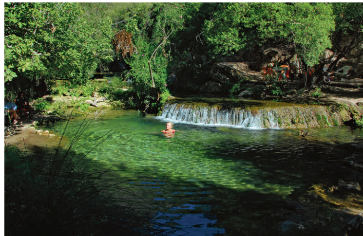
Erfrischung bei den Petit Cascade in Akchour – eine natürliche Wellnessoase.

Marokko bietet eine einzigartige Mischung aus orientalischem Flair, abwechslungsreichen Landschaften und gastfreundlicher Kultur. Als Reiseland ist es ideal für Wohnmobil-Touristen: gut ausgebaute Hauptstrassen verbinden lebhafteste Städte wie Marrakesch und Fès mit abgelegenen Berberdörfern, den Sanddünen der Sahara und der rauen Atlantikküste. Übernachtungsmöglichkeiten gibt es in Form von Campingplätzen, Stellplätzen oder wildem Campen – Letzteres ist in vielen Gegenden problemlos möglich, jedoch immer mit Respekt vor den lokalen Gegebenheiten. Das Klima ist je nach Region unterschiedlich. Im Norden herrscht ein mediterranes Klima mit heißen Sommern und milden Wintern, während der Süden durch Wüstenklima geprägt ist – hier sind die Tage oft heiss und die Nächte kühl. Das Atlasgebirge sorgt für eine klimatische Trennlinie und bietet selbst im Sommer angenehm kühle Temperaturen in den Höhenlagen. Marokko lässt sich grob in vier Regionen unterteilen: die fruchtbaren Küstengebiete am Atlantik und Mittelmeer, die gewaltigen Gebirgsketten des Hohen und Mittleren Atlas, die karge Wüstenlandschaft im Süden sowie die pulsierenden Städte, die das kulturelle Herz des Landes bilden.