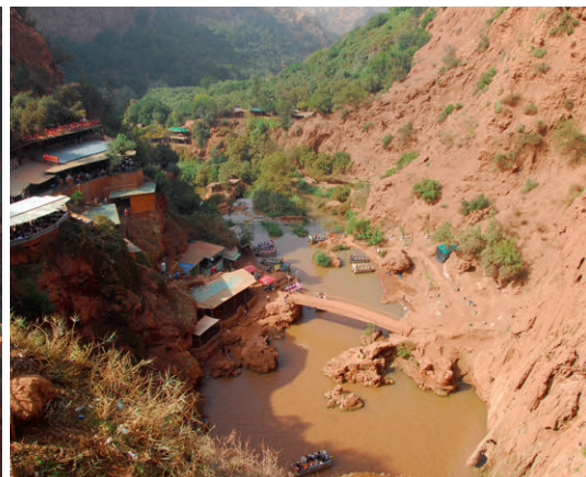
Die Cascade Ouzoud von oben – der Blick auf die schäumenden Wassermassen.