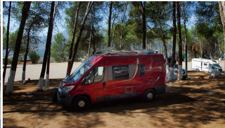
Campingplatz mit Ausblick – Erholung pur unter den Pinienbäumen bei Chefchaouen.

Marokko bietet eine einzigartige Mischung aus orientalischem Flair, abwechslungsreichen Landschaften und gastfreundlicher Kultur. Als Reiseland ist es ideal für Wohnmobil-Touristen: gut ausgebaute Hauptstrassen verbinden lebhafteste Städte wie Marrakesch und Fès mit abgelegenen Berberdörfern, den Sanddünen der Sahara und der rauen Atlantikküste. Übernachtungsmöglichkeiten gibt es in Form von Campingplätzen, Stellplätzen oder wildem Campen – Letzteres ist in vielen Gegenden problemlos möglich, jedoch immer mit Respekt vor den lokalen Gegebenheiten. Das Klima ist je nach Region unterschiedlich. Im Norden herrscht ein mediterranes Klima mit heißen Sommern und milden Wintern, während der Süden durch Wüstenklima geprägt ist – hier sind die Tage oft heiss und die Nächte kühl. Das Atlasgebirge sorgt für eine klimatische Trennlinie und bietet selbst im Sommer angenehm kühle Temperaturen in den Höhenlagen. Marokko lässt sich grob in vier Regionen unterteilen: die fruchtbaren Küstengebiete am Atlantik und Mittelmeer, die gewaltigen Gebirgsketten des Hohen und Mittleren Atlas, die karge Wüstenlandschaft im Süden sowie die pulsierenden Städte, die das kulturelle Herz des Landes bilden.