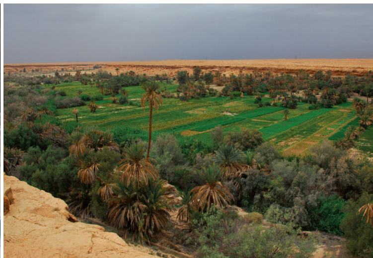
Das Ziz-Tal – grüne Lebensadern inmitten von Wüstenlandschaft.

gesäumt. Dann wird es ruhiger, der Weg wird wilder und steiler, endet schliesslich bei den Grand Cascade.