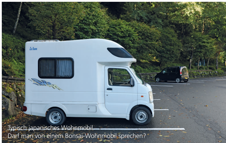
Typisch japanisches Wohnmobil. Darf man von einem Bonsai-Wohnmobil sprechen?