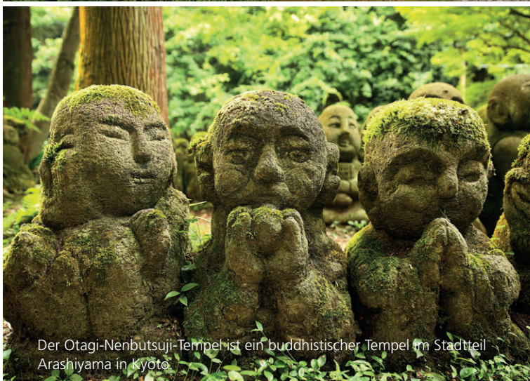
Der Otagi-Nenbutsuji-Tempel ist ein buddhistischer Tempel im Stadtteil Arashiyama in Kyoto.

BLICK ÜBER DIE WOHNMOBILE AUF DEM STELLPLATZ UND KYOTO.