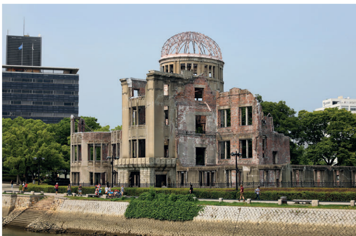
Hiroshima-Friedensgedenpark und Atomic Bomb Dome Peace Memorial.

Länge hat, darf man noch auf einem normalen Parkplatz parkieren. Hat man ein grösseres Fahrzeug, muss man sich zu den Bussen stellen und dann wird es teuer. Richtig teuer. Ich hatte mich daher bewusst gegen das geräumigere Alkovenmodell und für den Van entschieden. Denn in Japan geht es oft eng zu. Diese Entscheidung erwies sich als genau richtig.