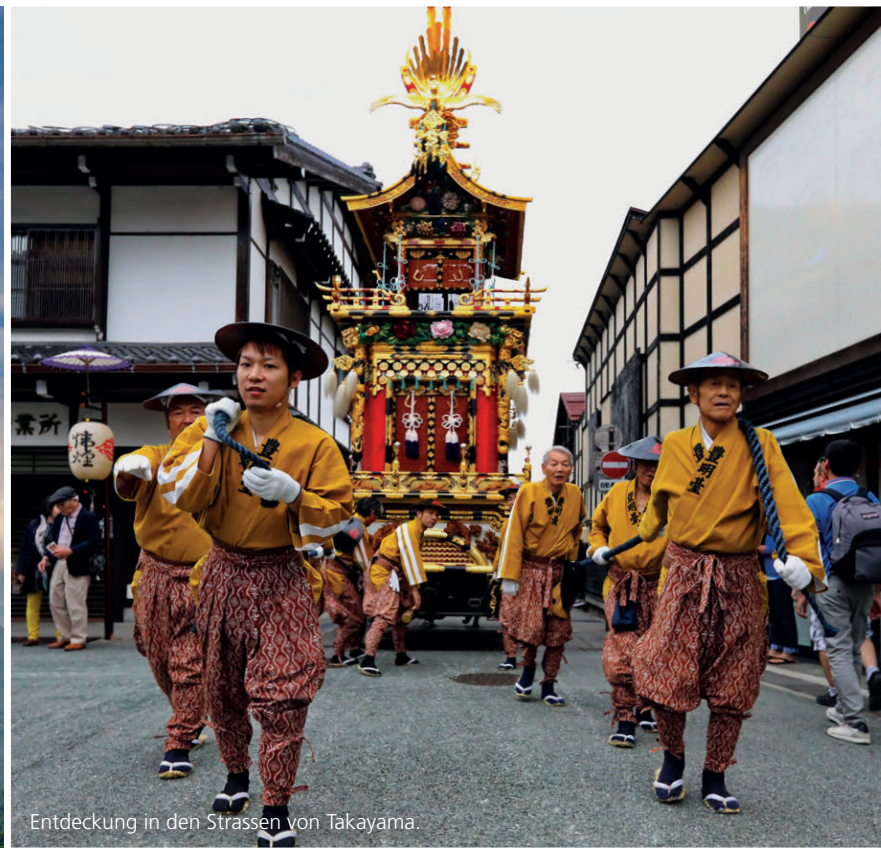
Entdeckung in den Strassen von Takayama.

DER BEI JAPANERN HEILIGE FUJI-SAN IST DER WOHL BEKANNTESTE VULKAN IN JAPAN.