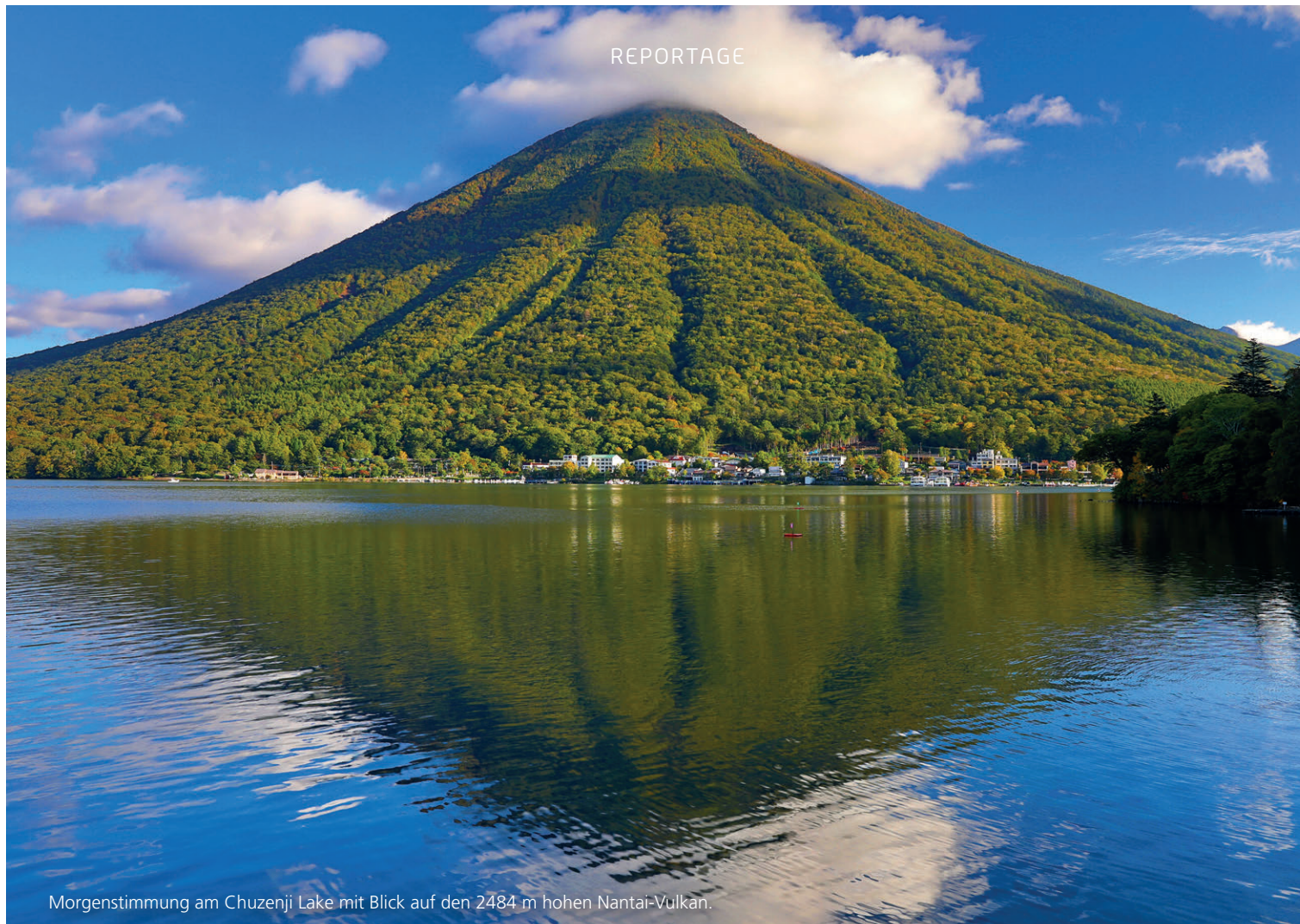
Morgenstimmung am Chuzenji Lake mit Blick auf den 2484 m hohen Nantai-Vulkan.

ähnlich gestalten, bleibt unbegründet, auf dem Rückweg sind die Kehren deutlich grosszügiger gestaltet. Nun sehe ich mir Gujo noch bei Tageslicht an. Die 40000 Einwohner zählende Stadt am Nagara-Fluss wurde 1652 bei einem grossen Brand fast völlig zerstört. Beim Wiederaufbau integrierte man ein ausgeklügeltes Kanalsystem, um bei einem Feuer überall in der Stadt sofort genügend Wasser zum Löschen zur Verfügung zu haben. Im Alltag werden die Kanäle ebenfalls genutzt. Ich muss schmunzeln, als ich die Behälter mit Obst und Gemüse im Wasser erblicke, die man wohl zum Kühlen dort hingestellt hat. Andernorts wird Wäsche gewaschen. Das Quellwasser hat auch gute Trinkwasserqualität, zumindest vor dem Wäschewaschen. An mehreren Stellen werden an kleinen Brunnen Trinkbecher zur Verfügung gestellt.