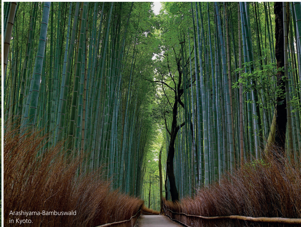
Arashiyama-Bambuswald in Kyoto