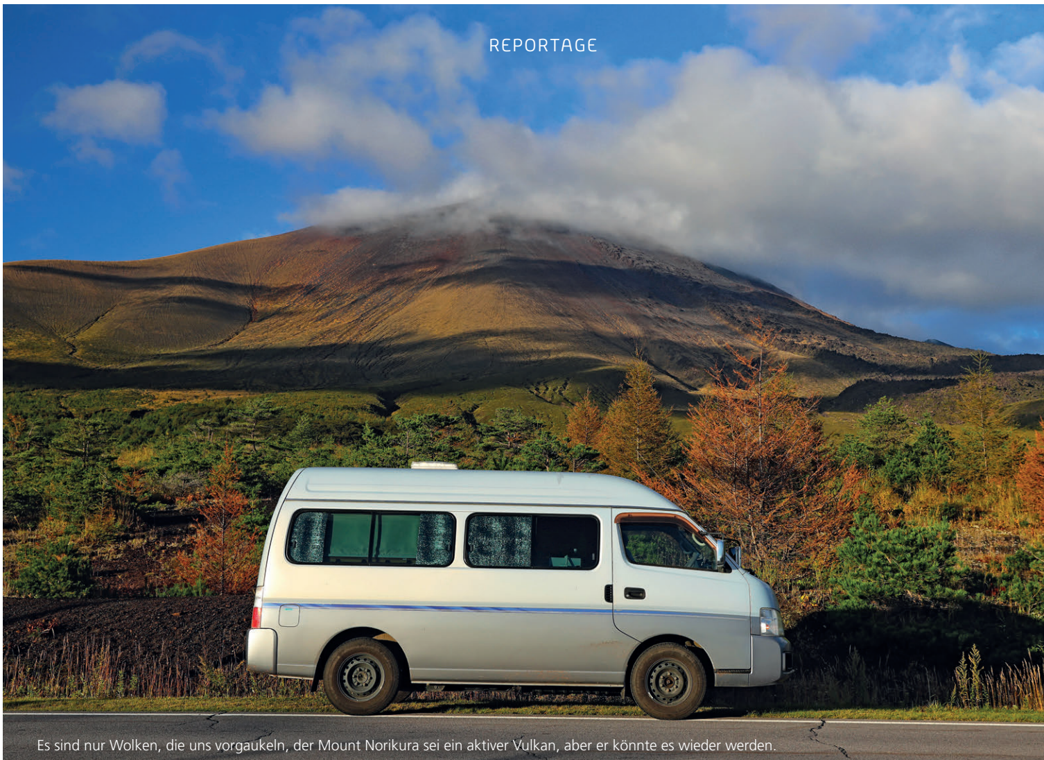
Es sind nur Wolken, die uns vorgaukeln, der Mount Norikura sei ein aktiver Vulkan, aber er könnte es wieder werden.

heiss, man würde sich sofort verbrühen. Von hier wird das Wasser über hölzerne Leitungen an die umliegenden Badeanstalten verteilt. In der Edo-Zeit hat sich die Yumoni-Tradition entwickelt, bei welcher das heisse Wasser in anstrengender Handarbeit durch kräftiges Umrühren mit Holzpaddeln abgekühlt wird. Heute kann man sich dieses spritzige Schauspiel bei Vorführungen für Touristen ansehen, die täglich abgehalten werden. Begleitet wird die Show von japanischer Musik, deren hohe und teilweise schrille Töne für unsere Ohren auf Dauer doch recht anstrengend sind.