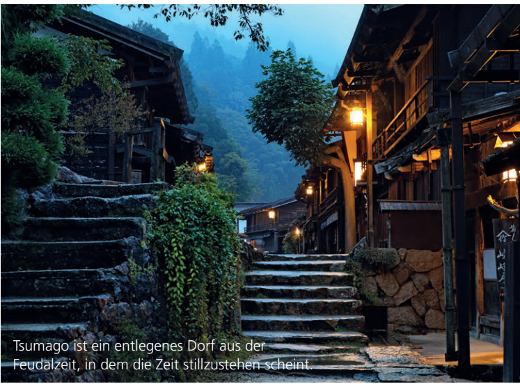
Tsumago ist ein entlegenes Dorf aus der Feudalzeit, in dem die Zeit stillzustehen scheint.