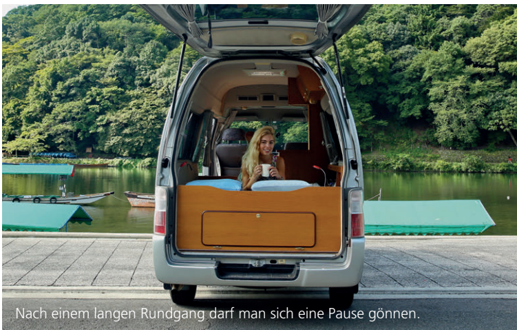
Nach einem langen Rundgang darf man sich eine Pause gönnen.