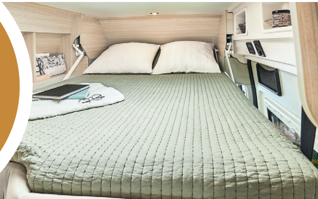
In Heckschlafzimmer umwandelbare Sitzgruppe