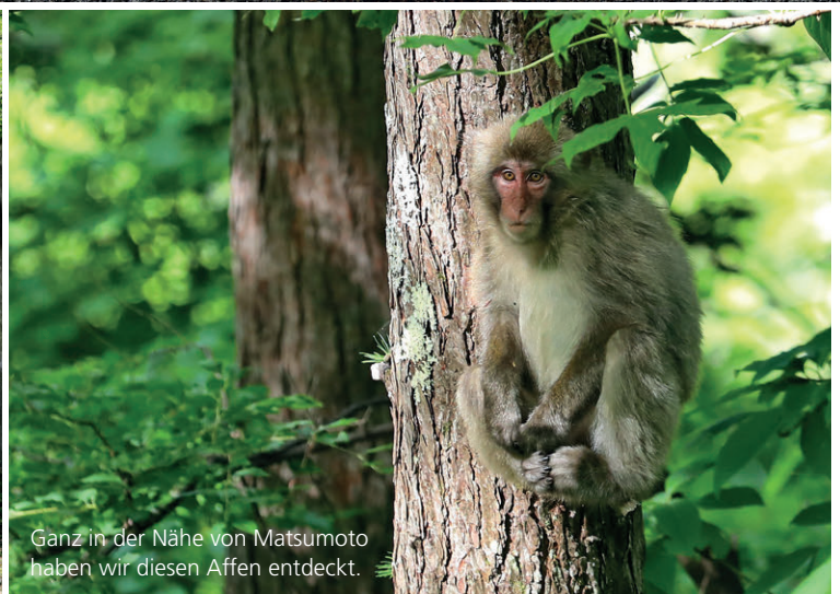
Ganz in der Nähe von Matsumoto haben wir diesen Affen entdeckt.