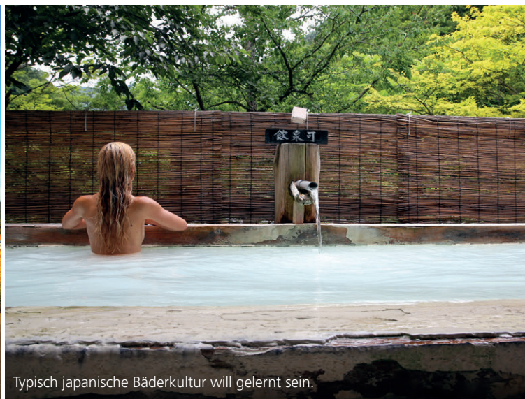
Typisch japanische Bäderkultur will gelernt sein.

bin ich dennoch satt und zufrieden. Ob ich mich nun entschuldigen muss, dass ich alles aufgegessen habe?