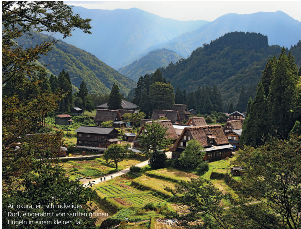
Ainokura, ein schnückerliches Dorf, eingerahmt von sanften grünen Hügeln in einem kleinen Tal.

Die heißen Bäder gehören zu Japan. Aber auf dem Weg dorthin kann es einen kalt erwischen: «No Tattoos» steht da womöglich (auch auf Englisch) am Eingang. Und Tätowierungen können auf der Japanreise tatsächlich zum Problem werden. In Japan werden vor allem grossflächige Tätowierungen mit den Schlägertypen der Yakuza und damit mit dem organisierten Verbrechen assoziiert. Zum typischen Erscheinungsbild der Gang-Mitglieder gehört neben auffällig bunten Anzügen nämlich auch, dass sie am ganzen Körper tätowiert sind. Kein Wunder also, dass Hotelmanager Tätowierungen nicht gern in ihrem Wellness-Bereich sehen – auch weil Durchschnittsjapaner zwar fast nie mit Yakuza zu tun haben, aber genügend Yakuza-Filme gesehen haben, um über einen tätowierten Rücken zu erschrecken. Im Zuge einer grossen Anti-korruptionskampagne haben die meisten Bäder Tatoos verboten. Und weil Regeln in Japan ganz strikt eingehalten werden, gilt das zumindest technisch auch für einen einzelnen Gekko am Knöchel einer Touristin. Ausnahmen findet man unter: www.tattoo-friendly.jp