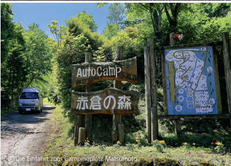
Die Einfahrt zum Campingplatz Matsumoto