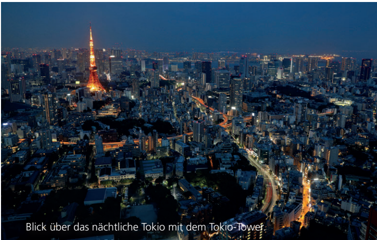
Blick über das nächtliche Tokio mit dem Tokio-Tower.