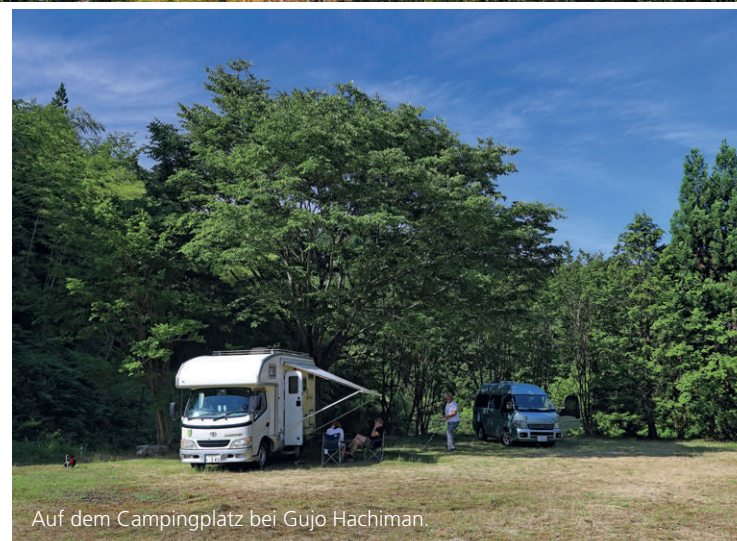
Auf dem Campingplatz bei Gujo Hachiman.

Die heißen Bäder gehören zu Japan. Aber auf dem Weg dorthin kann es einen kalt erwischen: «No Tattoos» steht da womöglich (auch auf Englisch) am Eingang. Und Tätowierungen können auf der Japanreise tatsächlich zum Problem werden. In Japan werden vor allem grossflächige Tätowierungen mit den Schlägertypen der Yakuza und damit mit dem organisierten Verbrechen assoziiert. Zum typischen Erscheinungsbild der Gang-Mitglieder gehört neben auffällig bunten Anzügen nämlich auch, dass sie am ganzen Körper tätowiert sind. Kein Wunder also, dass Hotelmanager Tätowierungen nicht gern in ihrem Wellness-Bereich sehen – auch weil Durchschnittsjapaner zwar fast nie mit Yakuza zu tun haben, aber genügend Yakuza-Filme gesehen haben, um über einen tätowierten Rücken zu erschrecken. Im Zuge einer grossen Anti-korruptionskampagne haben die meisten Bäder Tatoos verboten. Und weil Regeln in Japan ganz strikt eingehalten werden, gilt das zumindest technisch auch für einen einzelnen Gekko am Knöchel einer Touristin. Ausnahmen findet man unter: www.tattoo-friendly.jp