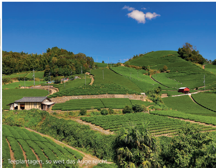
Teeplantagen, so weit das Auge reicht.