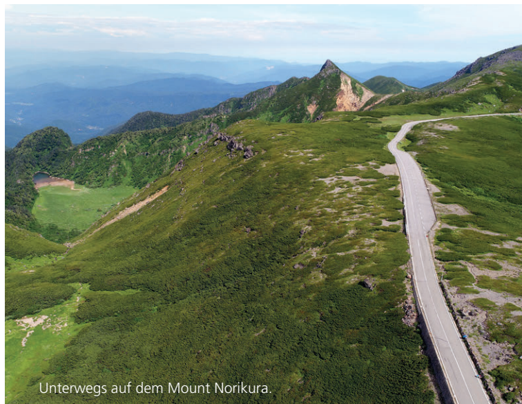
Unterwegs auf dem Mount Norikura.