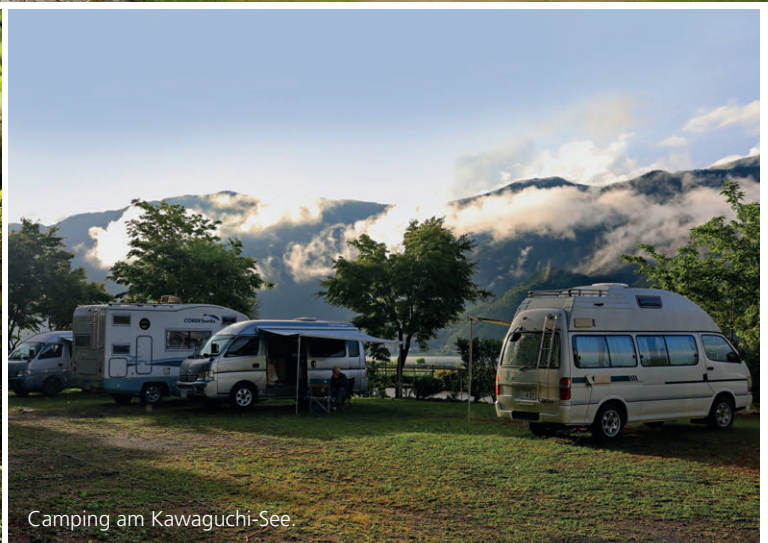
Camping am Kawaguchi-See