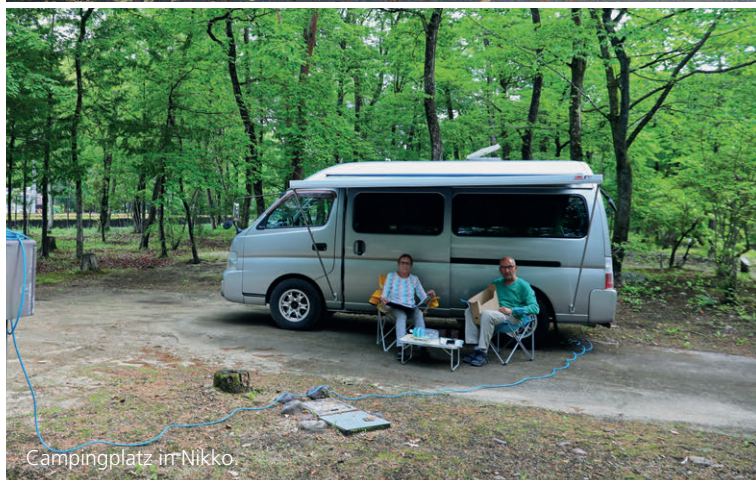
Campingplatz im Nikko.

Bei Japan denken viele im ersten Moment wohl eher an negative Ereignisse wie den Atombombenabwurf über Hiroshima oder das Unglück im Kernkraftwerk Fukushima. Erst nach diesen Schreckensbildern kommen einem der majestätische Vulkan Fujiyama in den Sinn, der seinen ebenmässigen, schneebedeckten Kegel in einem der vielen Seen spiegelt. Oder versteckte Tempel, aufwendig verzierte Pagoden und geheimnisvoll anmutende Geishas. Doch Japan ist noch weitaus mehr, und wir wissen erstaunlich wenig über das schmale Land der aufgehenden Sonne. Und noch weniger ist den meisten bewusst, dass man dieses Fleckchen Erde sogar mit dem Camper bereisen kann. Doch das wird sich bald ändern!