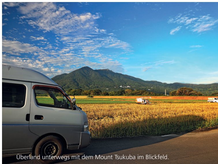
Überland unterwegs mit dem Mount Tsukuba im Blickfeld.