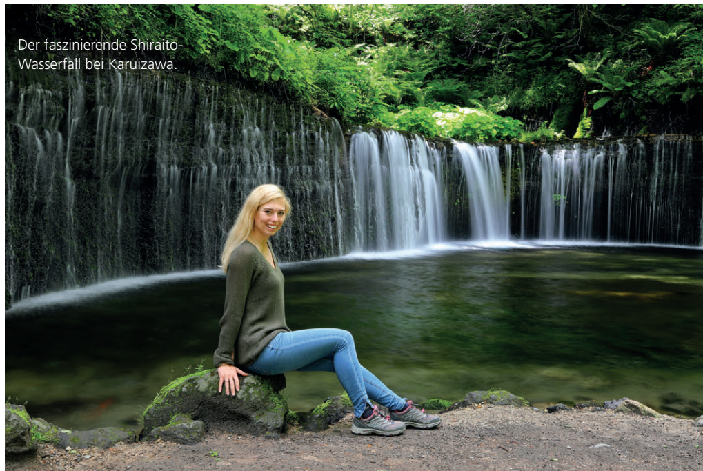
Der faszinierende Shiraito-Wasserfall bei Karuizawa.