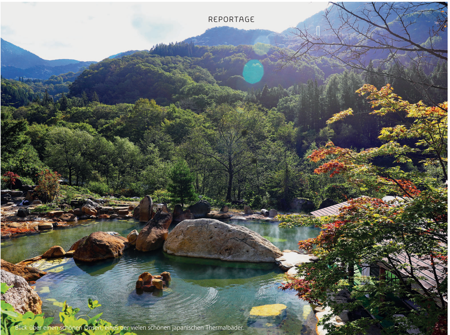
Blick über einen schönen Onsen, eines der vielen schönen japanischen Thermalbäder.

Genug Reise-Alltagskram, Zeit für Sehenswürdigkeiten! Mein erstes grosses Ziel ist die Tempel-Stadt Nikko, die wunderschön in den Bergen im gleichnamigen Nationalpark liegt. Ich steuere den Campingplatz im Süden der Stadt an. Im Grunde sieht das Gelände fast aus wie ein Campingplatz in Europa. Er verfügt über Stellplätze im Wald, teilweise sogar mit Stromanschluss. Der Anschluss ist übrigens der gleiche wie in Nordamerika. Duschen und Toiletten sind ebenfalls vorhanden, sogar Waschmaschinen und Trockner. Zu verstehen, wie man die Maschinen bedient, ist allerdings für uns Europäer eine Herausforderung, da alles nur auf Japanisch angeschrieben ist. Ich gehe weiter, die Reise hatte schliesslich erst begonnen, und noch gibt das Reisegepäck genug frische Wäsche her, so dass ich das Thema Wäschewaschen gut vertagen kann.