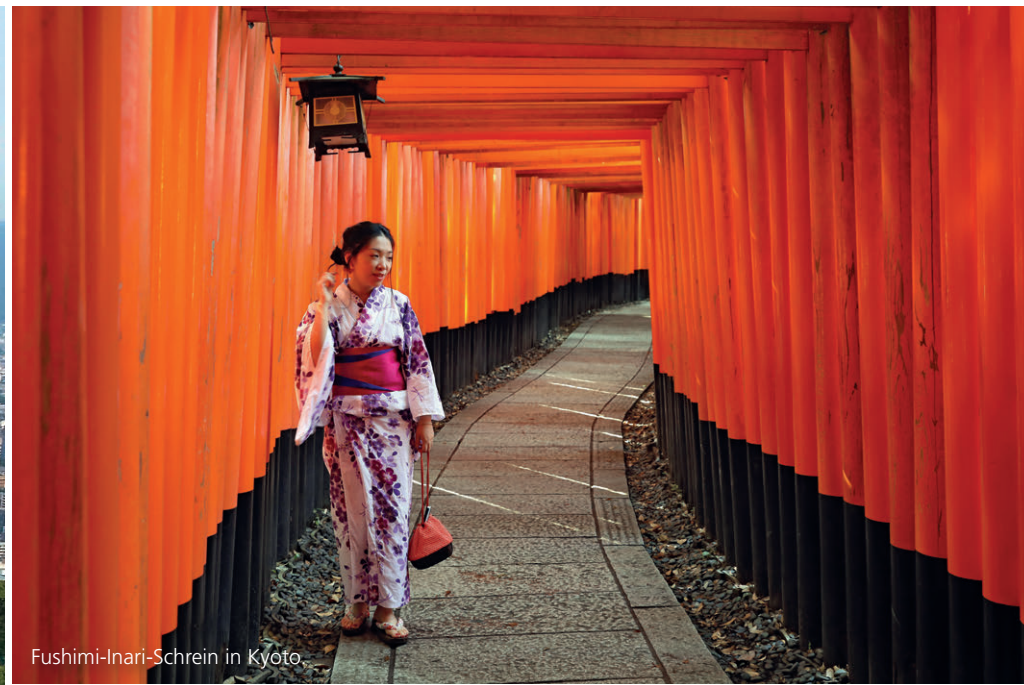
Fushimi-Inari-Schrein in Kyoto