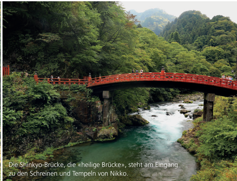
Die Shinkyo-Brücke, die «heilige Brücke», steht am Eingang zu den Schreinen und Tempeln von Nikko.

ihren roten Hauben und Lätzchen, die von Moos bewachsen und von Bäumen umgeben sind. Der Ort hatte etwas sehr Friedvolles und ist perfekt, um den Touristenströmen zu entkommen.