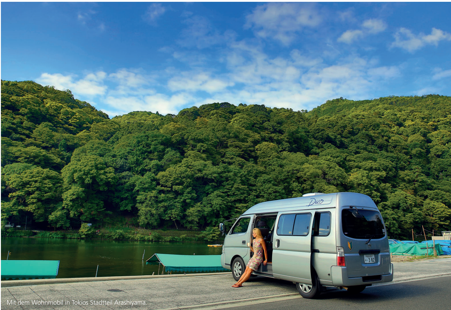
Mit dem Wohnmobil in Tokios Stadtteil Arashiyama.