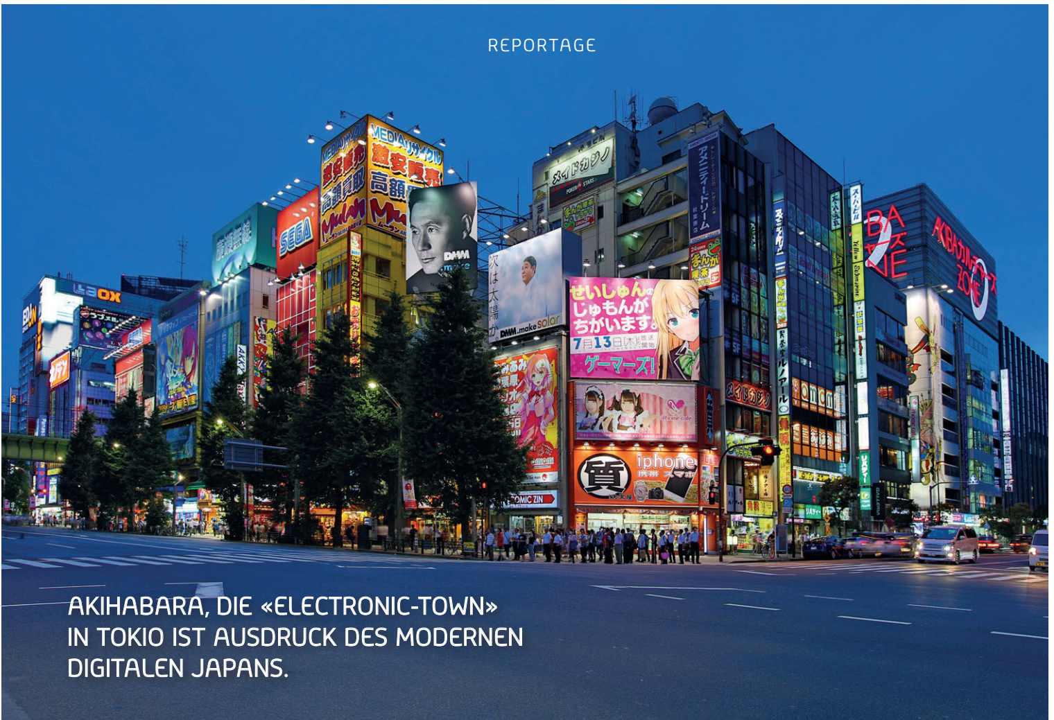
AKIHABARA, DIE «ELECTRONIC-TOWN» IN TOKIO IST AUSDRUCK DES MODERNEN DIGITALEN JAPANS.