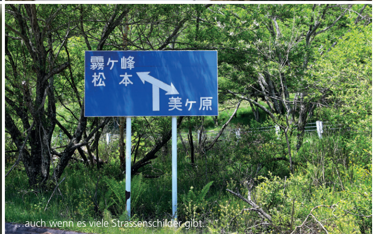
...auch wenn es viele Strassenschilder gibt.