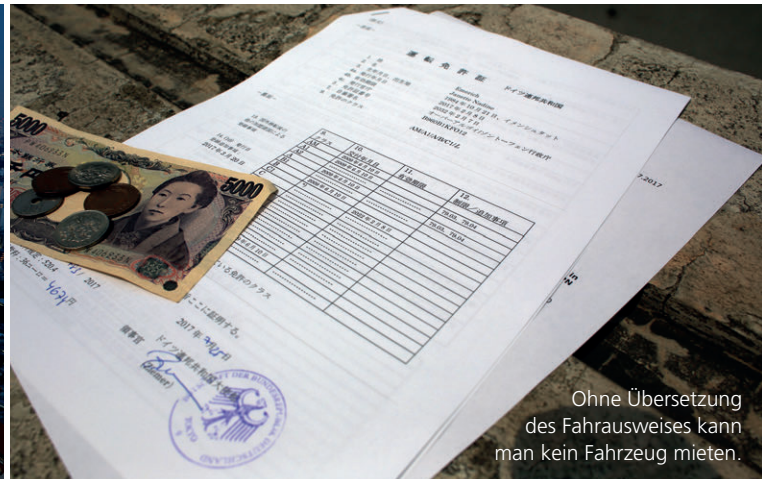
Ohne Übersetzung des Fahrausweises kann man kein Fahrzeug mieten.