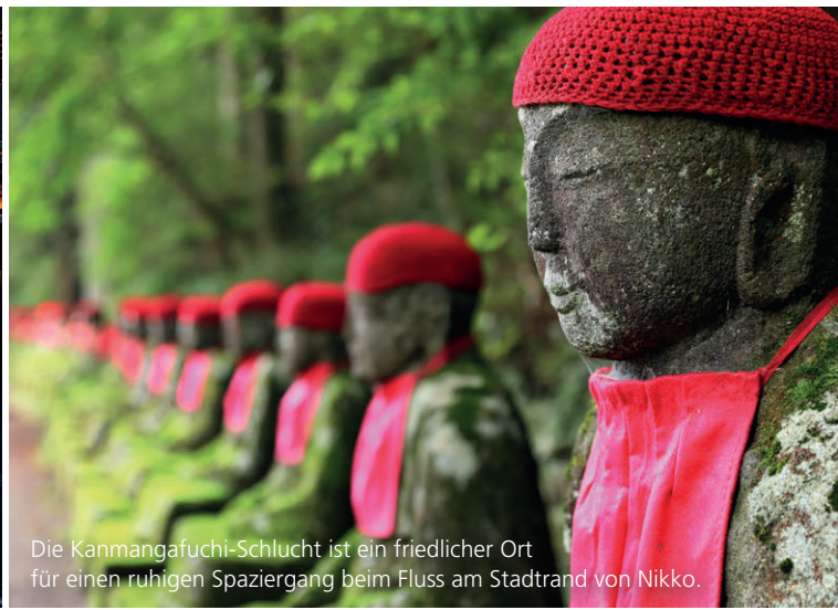
Die Kanmangafuchi-Schlucht ist ein friedlicher Ort für einen ruhigen Spaziergang beim Fluss am Stadtrand von Nikko.