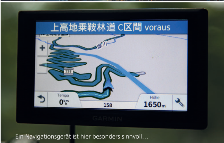
Ein Navigationsgerät ist hier besonders sinnvoll...