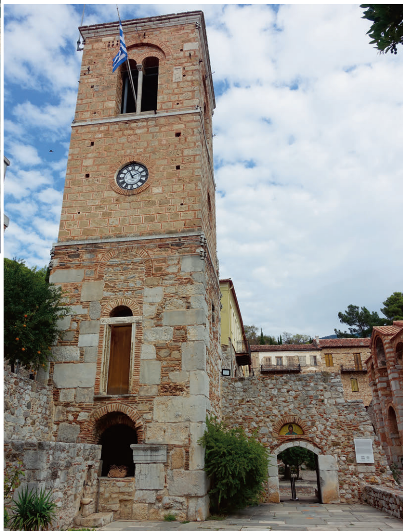
Das Kloster Hosios Lukas ist eines der drei bedeutendsten byzantinischen Klöster in Griechenland.

Wildcampen ist und bleibt in Griechenland verboten. Wer dieses Verbot missachtet, kann schnell mit Busse von 300 Euro oder auch mal mehr bestraft werden. Ende Saison, bei diskretem und korrektem Verhalten ist die Toleranz wohl etwas grösser. Und man kann auch mal den Besitzer des Parkplatzes eines Restaurants um Erlaubnis fragen. Ende September, Anfang Oktober ist an vielen Orten in Griechenland der grosse Touristenansturm vorbei. Das hat den Vorteil, dass das eigentliche griechische Leben wieder sichtbar wird, andererseits ist es eher mal möglich, auf einem Stellplatz zu übernachten.