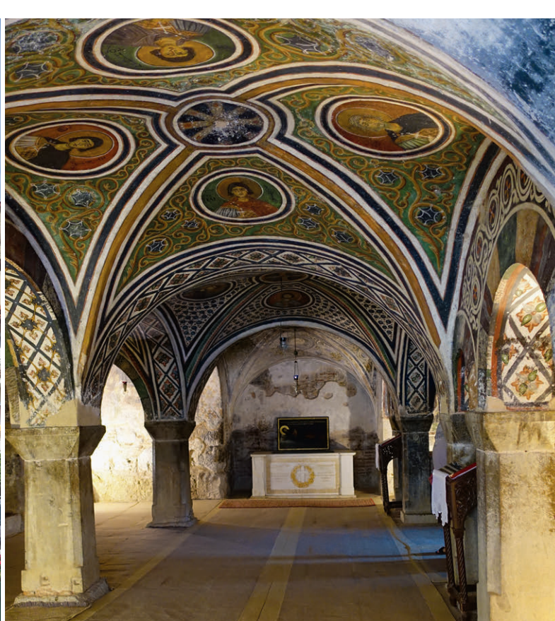
Eindrucksvoll verziertes Gewölbe im Kloster Hosios Lukas.