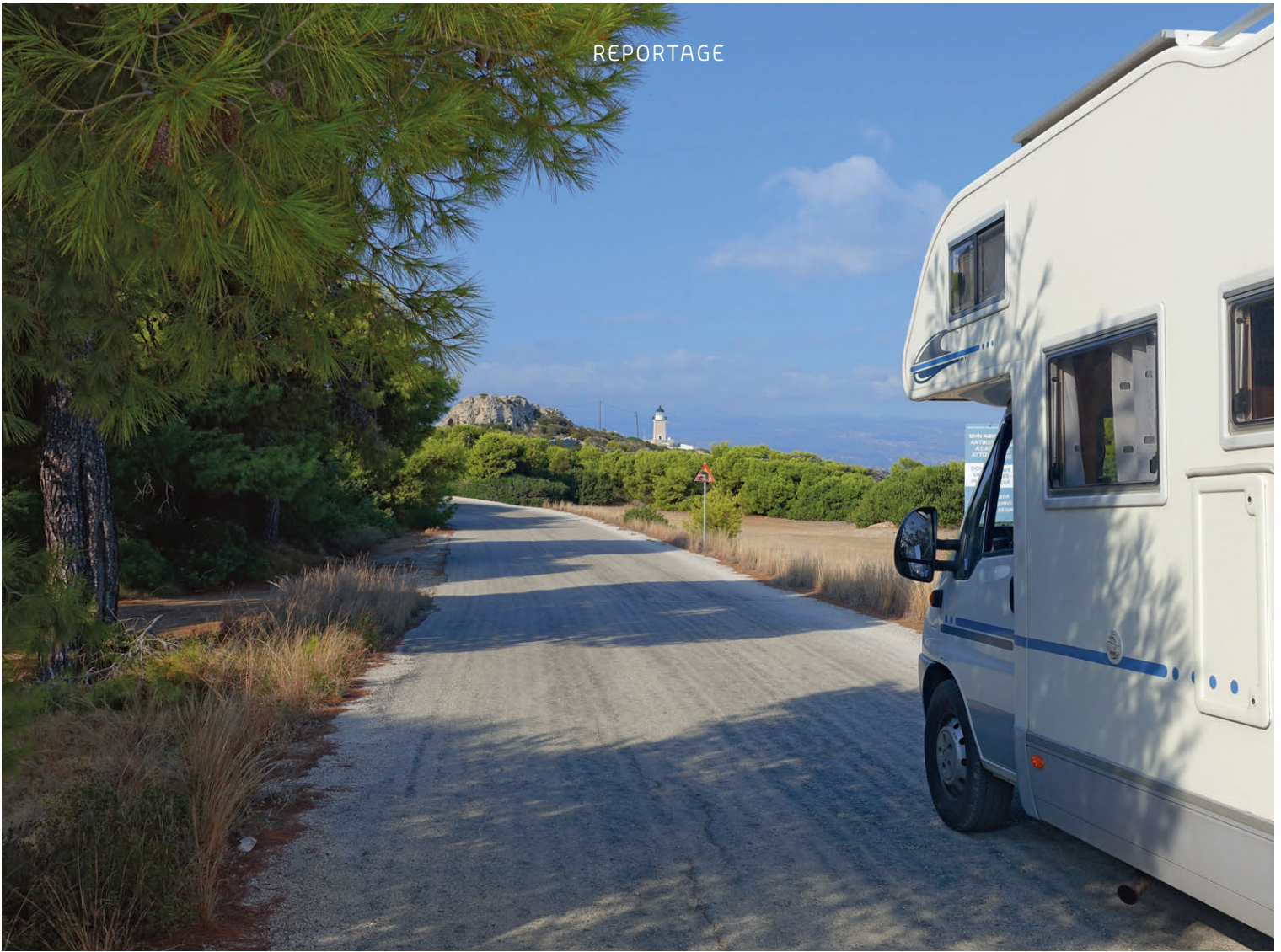
Bei der Anfahrt zum Kap Melangavi sehen wir den Faros Melangavi von Weitem. Der kurze Fussweg über Stock und Stein zum Leuchtturm lohnt sich wegen der tollen Aussicht.

Über die eindrückliche Rio-Andirrio-Brücke oder offiziell Charilaos-Trikoupis-Brücke gelange ich nach der Ankunft in Patras auf die nördliche Seite des Golfs von Korinth. Nach der langen Anfahrt bis Ancona und einer Nacht auf der mässig sauberen Fähre mit Sturm und nicht sehr freundlichem Personal bin ich auf der Suche nach Ferienstimmung. Ich finde sie gut 16 Kilometer hinter Erateini am Kiesstrand von Agios Vasileios, an dem es einen Stellplatz für vier bis fünf Wohnmobile hat (Agios Vasileios, 38.347401, 22.358900). Der schöne Ausblick über die Bucht und das Meer lassen mich bei einem kühlen Bier in den Ferien ankommen.