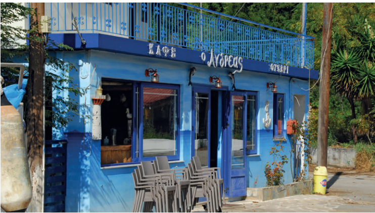
Fisch gibt es überall an der Küste. Hier die Fischtaverne bei Kotzika am Strand.