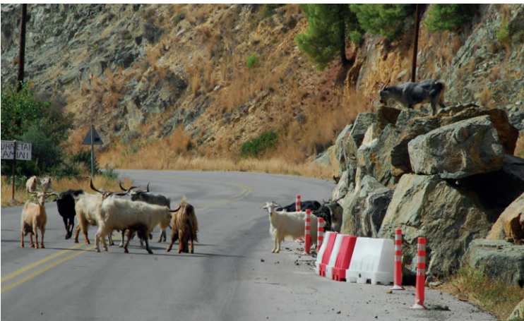
Damit muss man in Griechenland immer rechnen: Plötzlich steht eine Ziegenherde auf der Strasse.