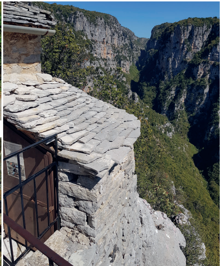
Eindrucklich ist der Blick auf die Vikos-Schlucht.