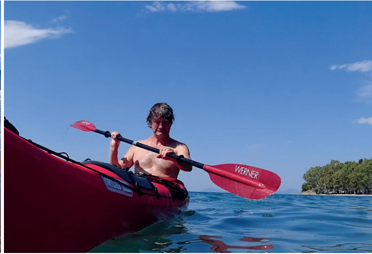
Oben: Für uns ein Paradies auf Erden – Euböa. Unten: Kleines Touristenhighlight – Schiffswrack in Elea.