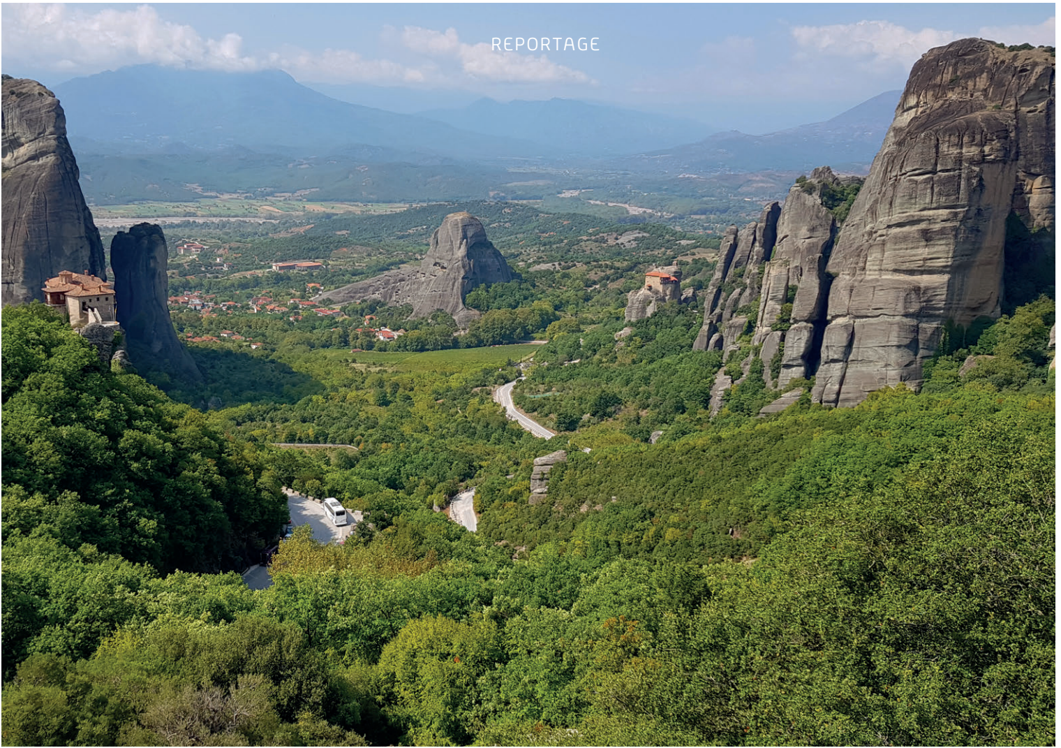
Beim Weltkulturerbe Meteora geniessen wir den Blick über die Landschaft.

In der schmalen Fahrrinne der Bucht von Igoumenitsa kommt unsere Fähre pünktlich am Vormittag an. Beim Einchecken in Ancona war es etwas komplizierter als in den Jahren davor. Aber ich hatte alle nötigen Formulare zum Registrieren schon vorab runtergeladen und ausgefüllt. Dazu einen QR-Code angefordert, den man kurz vor der Ankunft auf das Handy gesendet bekommt, schon sind die Covid-Bestimmungen für die Einreise nach Griechenland erledigt. Auf der Fähre müssen wir Maske tragen, aber daran hat man sich ja schon im Alltag gewöhnt.