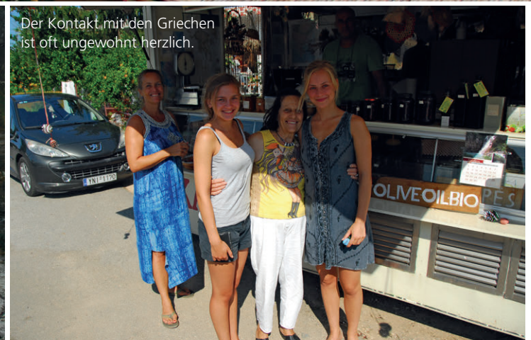
Der Kontakt mit den Griechen ist oft ungewohnt herzlich.