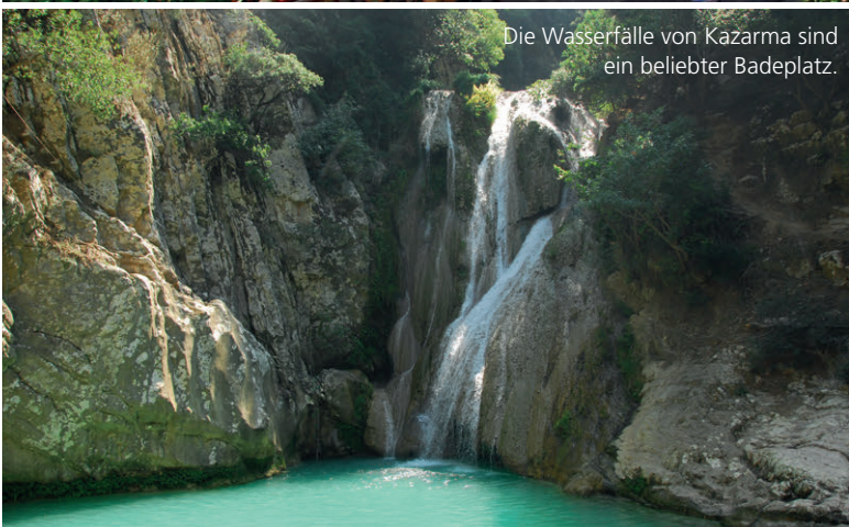
Die Wasserfälle von Kazarma sind ein beliebter Badeplatz.