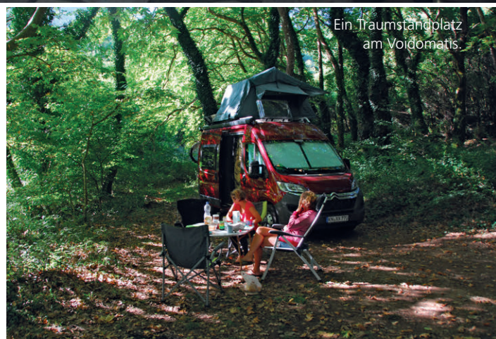
Ein Traumcampplatz am Voidomatis.

Frühling und Herbst sind in Griechenland nur sehr kurze Phasen, sie können aber sehr interessant für Reisen ins Land sein. Wer die grosse Hitze des Sommers nicht mag, für den könnte der Frühling mit April und Mai interessant sein. Die Sommer präsentieren sich in ganz Griechenland als heiss und trocken. Im Süden auf dem Peloponnes ist es meist schon im Juni heiss und es fällt so gut wie kein Niederschlag, Temperaturen über zwanzig Grad herrschen durchweg von Mai bis Oktober. Der Herbst ist kaum spürbar. Vor allem an den Küstengebieten ist es dann sehr angenehm, die Wassertemperaturen erreichen sogar im September ihren höchsten Stand.