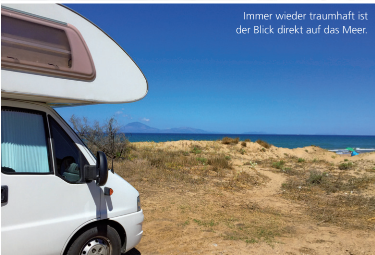
Immer wieder traumhaft ist der Blick direkt auf das Meer.