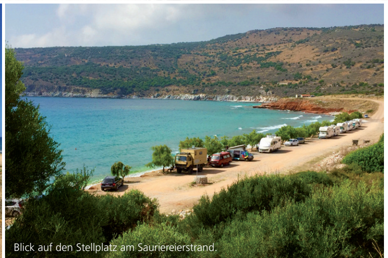
Blick auf den Stellplatz am Sauriereierstrand.

Nach rund neun Stunden Fahrt über Mailand nach Ancona ist das Wohnmobil im Bauch der Fähre verschwunden, und die Mannschaft erledigt die letzten Arbeiten vor dem Ablegen des riesigen Schiffes der Reederei Minoan Lines, das mich in den nächsten 23 Stunden nach Patras bringen soll. Leider gibt es keine Möglichkeit für Camping on Board, es bleibt, will ich nicht irgendwo in den Gängen am Boden oder auf einer Sitzbank schlafen, nur das Buchen einer Doppelkabine für mich allein oder eines Schlafsitzes für 90 Euro. Andere Mitreisende scheinen angesichts der Schnarch-