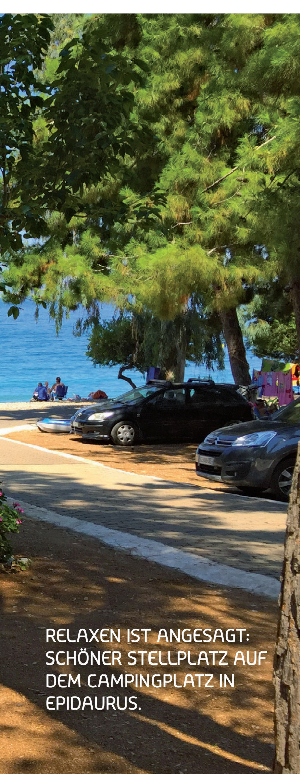
RELAXEN IST ANGESAGT: SCHÖNER STELLPLATZ AUF DEM CAMPINGPLATZ IN EPIDAURUS.