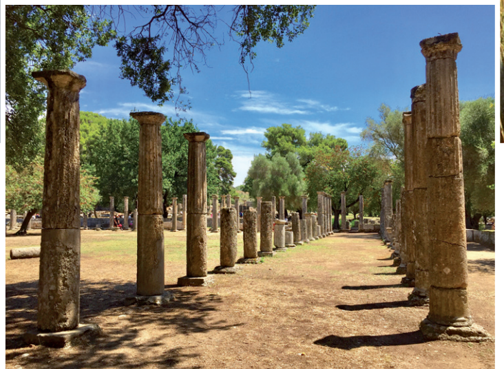
Kulturelles Highlight zum Abschluss: Besuch in Olympia.