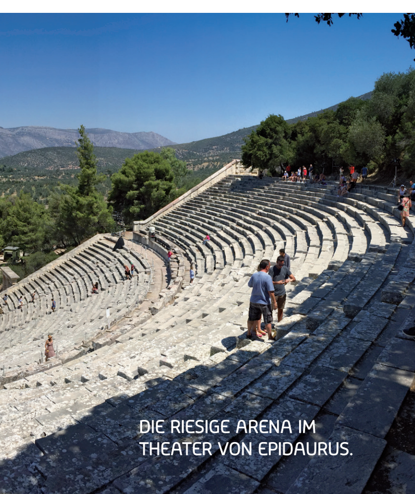
DIE RIESIGE ARENA IM THEATER VON EPIDAUROS.