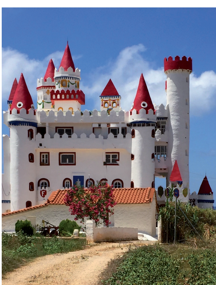
Das Märchenschloss sieht aus wie aus einem Kindermärchenbuch.

ich fühle mich frei und habe Lust, etwas zu entdecken.