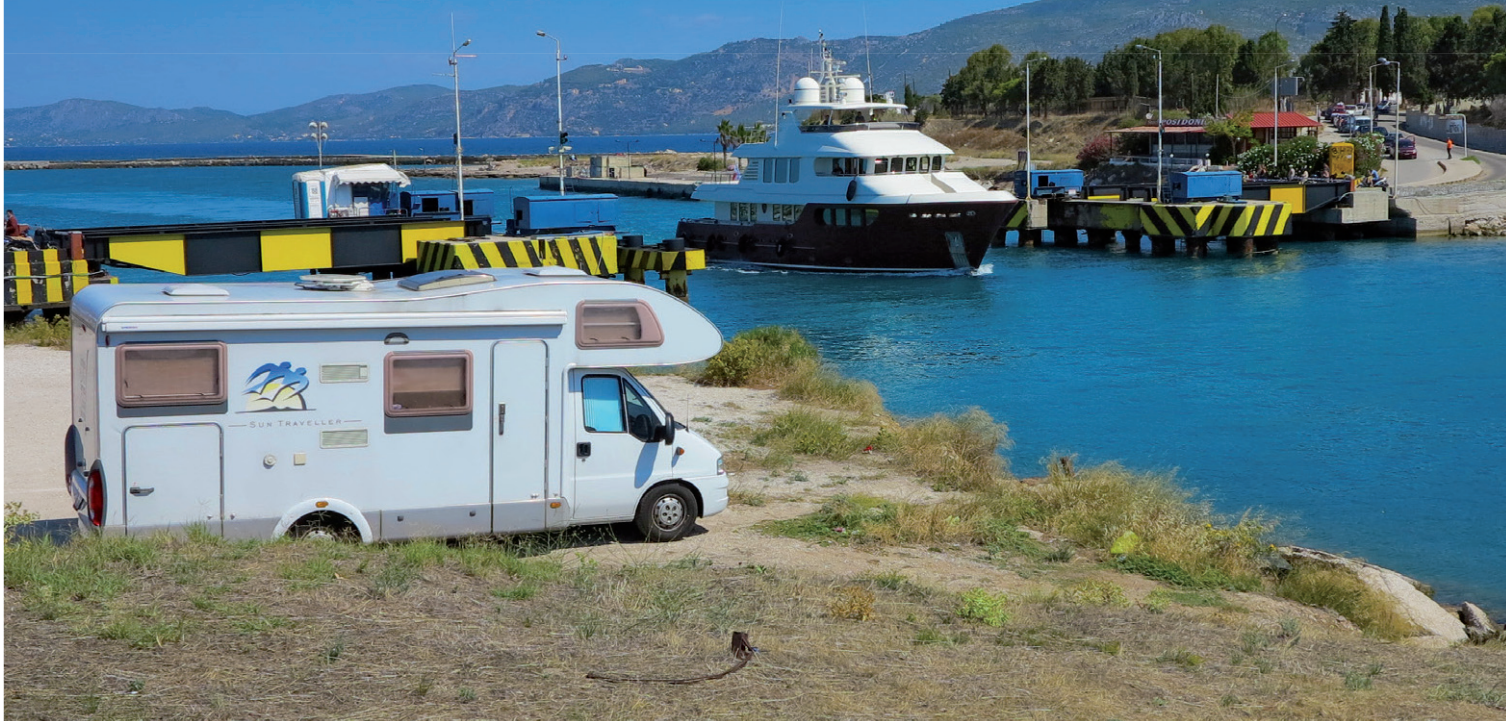
Einfahrt zum kleinen Camper-Stop.

UM BOOTEN DIE DURCHFAHRT ZU ERMÖGLICHEN, WIRD DIE BRÜCKE INS WASSER VERSENKT.