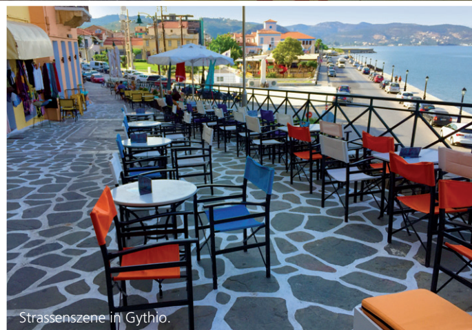
Strassenszene in Gythio.

Der Peloponnes gehört zu Südgriechenland und ist durch den Isthmus von Korinth im Norden vom Festland getrennt. Die einzige Festlandverbindung wurde mittlerweile getrennt, damit die Strasse von Korinth durchgängig beschiffbar ist. Nach Westen, also Italien zugewandt, befindet sich das Ionische Meer mit den beiden Inseln Kefalonia und Zakynthos. Im Osten liegt die Ägäis. Im Süden das offene Mittelmeer mit der vorgelagerten Insel Kithira. Der Peloponnes ist mit Gebirgen durchzogen. Viele Orte befinden sich an einem Hang und auch die reichlich vorhandene Küstenfläche wird, neben vielen schönen und teilweise auch langen Sandstränden, immer wieder durch steil abfallende Klippen gekennzeichnet. Die Gesamtfläche des Peloponnes beträgt rund 21 500 Quadratkilometer. Der höchste Berg ist das Tayetos-Gebirge mit 2407 m Höhe. Die maximale Entfernung von Ost nach West und von Nord nach Süd beträgt jeweils rund 250 km. Auf dem Peloponnes liegt die Einwohnerzahl bei etwas über einer Million.