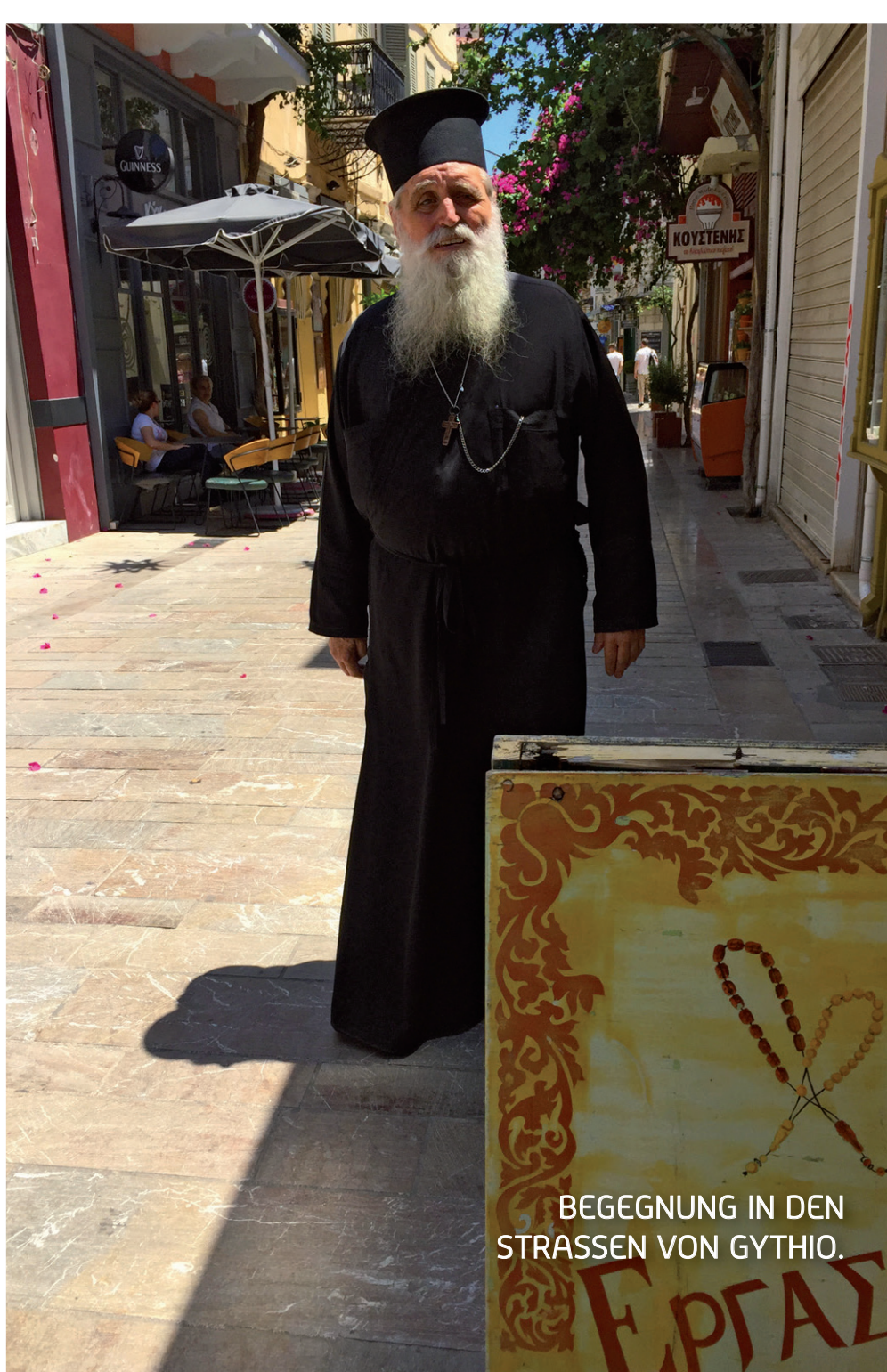
BEGEGNUNG IN DEN STRASSEN VON GYTHIO.

Der Peloponnes gehört zu Südgriechenland und ist durch den Isthmus von Korinth im Norden vom Festland getrennt. Die einzige Festlandverbindung wurde mittlerweile getrennt, damit die Strasse von Korinth durchgängig beschiffbar ist. Nach Westen, also Italien zugewandt, befindet sich das Ionische Meer mit den beiden Inseln Kefalonia und Zakynthos. Im Osten liegt die Ägäis. Im Süden das offene Mittelmeer mit der vorgelagerten Insel Kithira. Der Peloponnes ist mit Gebirgen durchzogen. Viele Orte befinden sich an einem Hang und auch die reichlich vorhandene Küstenfläche wird, neben vielen schönen und teilweise auch langen Sandstränden, immer wieder durch steil abfallende Klippen gekennzeichnet. Die Gesamtfläche des Peloponnes beträgt rund 21 500 Quadratkilometer. Der höchste Berg ist das Tayetos-Gebirge mit 2407 m Höhe. Die maximale Entfernung von Ost nach West und von Nord nach Süd beträgt jeweils rund 250 km. Auf dem Peloponnes liegt die Einwohnerzahl bei etwas über einer Million.