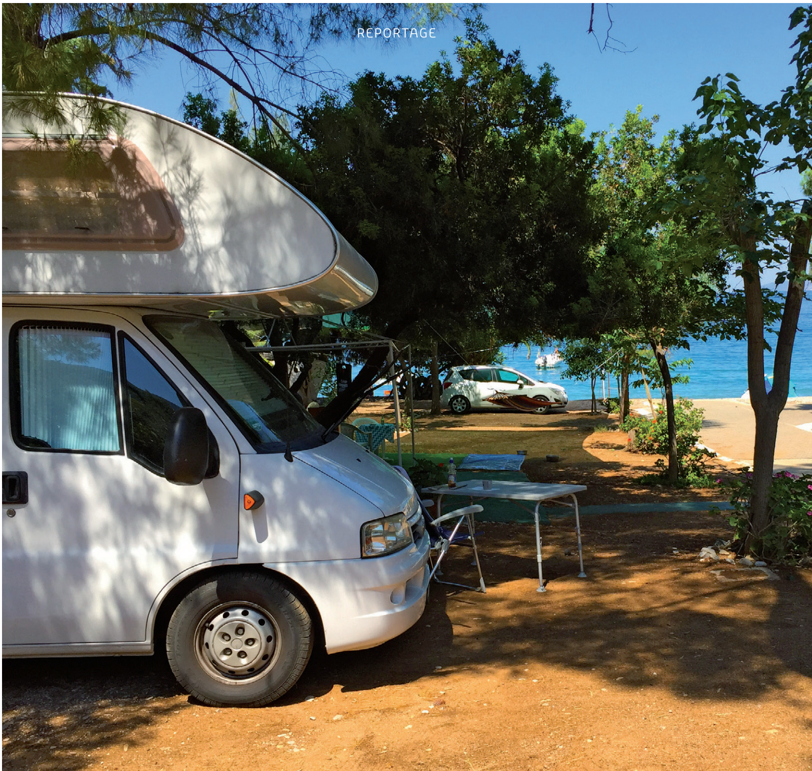
Valtaki Beach mit dem gestrandeten Schiff.