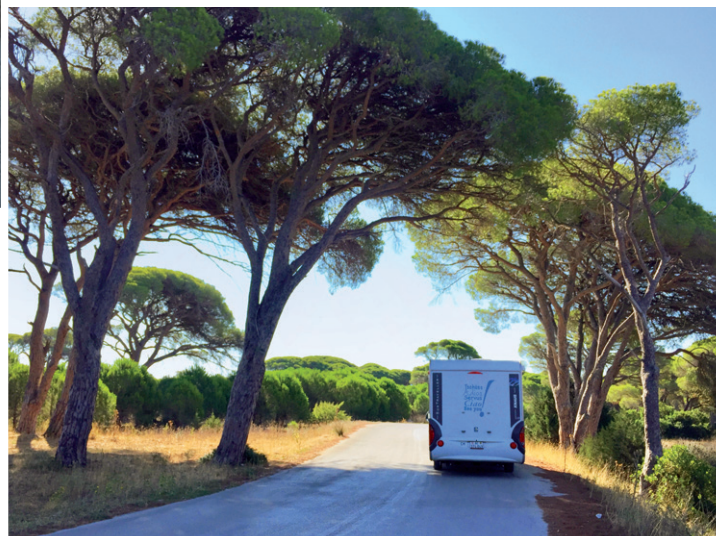
Neben den grossen Strassen wird es interessanter.